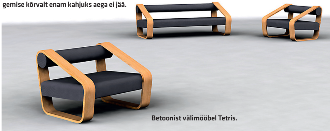
Betonist välimööbel Tetris.