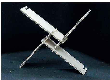
Modulitest kokkupandav riul Lop-lop.