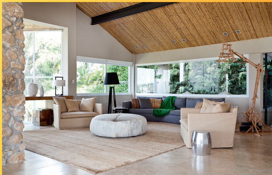
↑ Suurele perele mõeldes on istumis- ja eraldumiskohti loodud pigem palju.