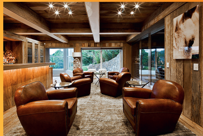
← Sisekujunduses pole peljatud kasutada värvi, moodsale disainile sekundeerivad mõned retroesemed.