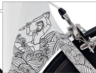
MOBY DICK - Täissüsinikust raam, terasest rattad ja Shimano Dura-Ace sadul. Hind 12 000 eurot.