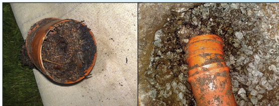
Selline näeb välja 1,5 aastat killustikus asetsenud toru, mis on ummistunud puulehtede ja okastega.

Sellise imbsüsteemi tööga ei ole aga kuigi pikk ja lõpeb varem või hiljem süsteemi ummistumisega. Katuselt sademeveega alla voolavad puulehed ja okkad ummistavad killustikus oleva toruotsa (foto 1). Selline ummistus võib lamekatusega hoones, kus sademeveetoru asub majas sees, tuua kaasa uputusolukorra ka toas.