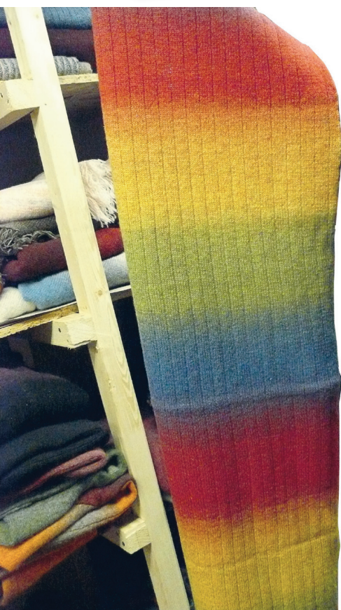
Masinkoes sall vikerkaarelõngast.