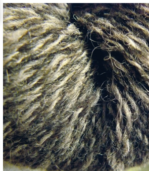
Mitmevärvilise lõnga saab ka erinevaid lõngu korrutades.

Kudum, kuhu on kootud heie, vanub väga kergesti. Vanutades saab anda kudumile tihedust ja muuta see mahulisemaks. Kui tahate eset vanutada, kuduge see veidi suurem – vanumise käigus võib kaotsi minna kuni kolmandik osa suuruselt.