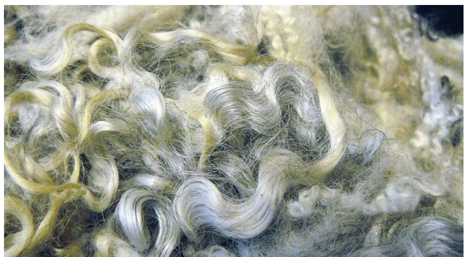
Rootsi peenvill, millest saab pehmet lõnga.