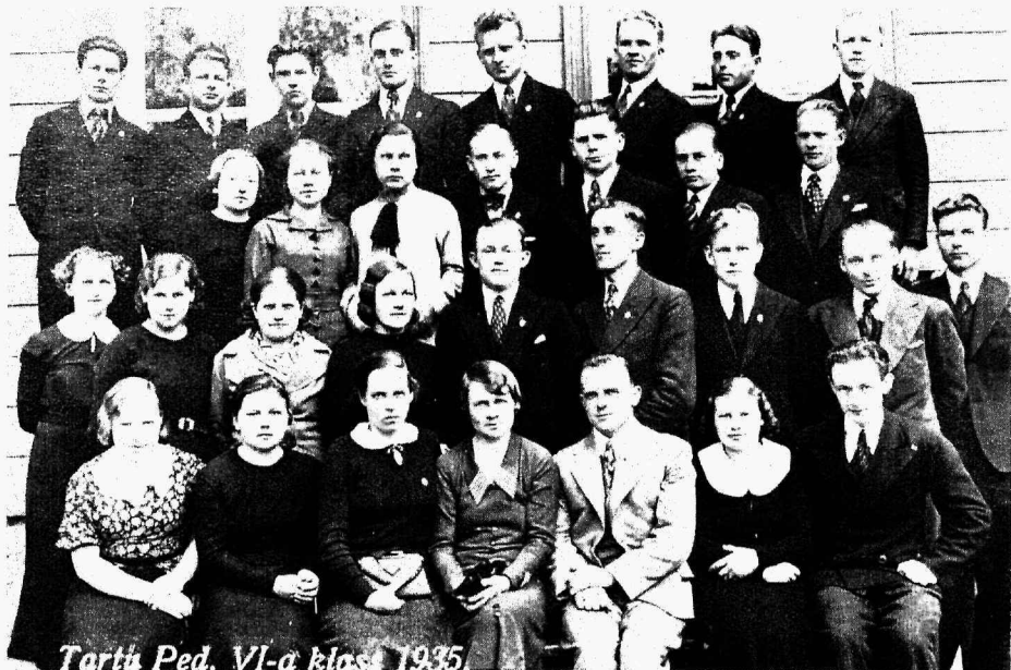
Tartu Ped. VI-a klass 1935

Tartu Pedagoogiumi VI a klass 1935. a. kevadel – Tartu Õpetajate Seminari 16. lend.