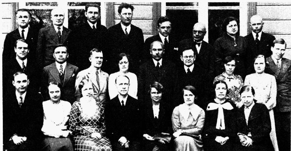
Tartu Pedagoogiumi õpetajad 1935. a. kevadel.