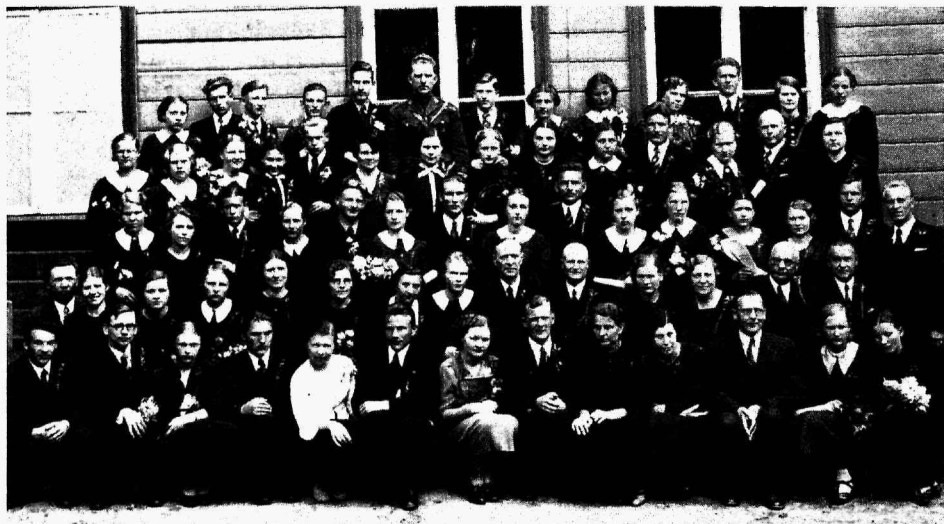
Tartu Pedagoogiumi 1. lennu ja Pedagoogiumi keskkooli 1. lennu lõpetajad koos õpetajatega 1937. a. kevadel. Pedagoogiumi 1. lend jäi ka viimseks.