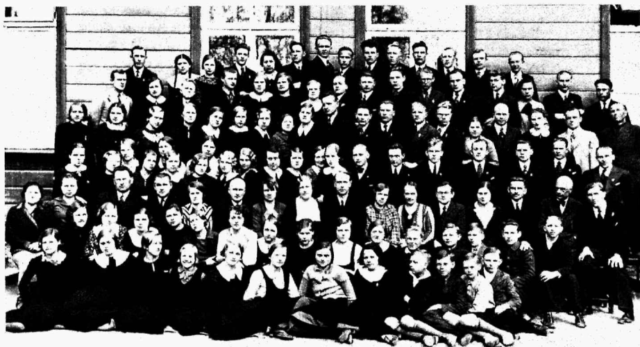
Tartu Pedagoogiumi õpetajad ja õpilased 1935. a. kevadel. Ees maas Pedagoogiumi keskkooli (progümnaasiumi) 3. kl. õpilased.