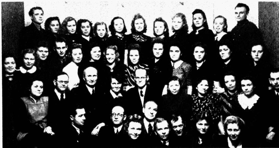
Tartu Õpetajate Seminari 1944. a. lõpetajad koos õpetajatega, pildistatud 12.2.1944.

Seminari viimane klass jätkas siiski tööd 15. veebruarini. Olime traditsioonikohaselt muretsenud endile lõpumärgid ja korraldasime märgi- ja lõpupeo tütarlaste internaadis Kalevi tänaval. See pidu, kuhu oli tulnud rohkesti õpetajaid ja ka kooli vilistlasi, jäi meie viimseks rohkemaarvuliseks kokkutulekuks. Mõne päeva pärast läksime laiali, et oodata asjade arengut. Ka koju sõit oli nii mõnelegi probleemiks, kuna Tapalt ida poole ei läinud ühtki erarongi, telefoniühendus oli kat-