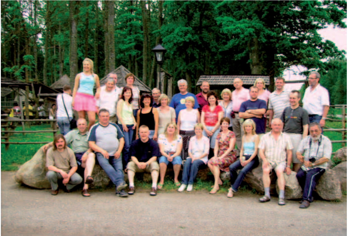
Õppereis Rumeeniasse 2007.