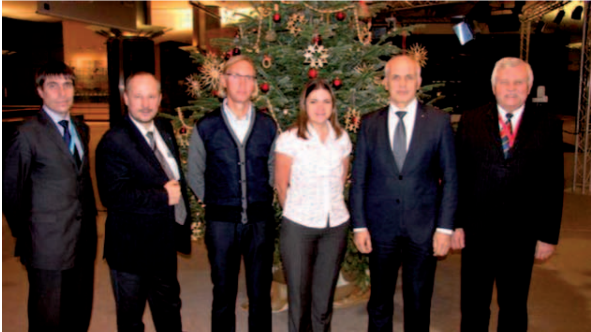
Regioonide Komitee Eesti delegatsiooni liikmed 2011/2012.