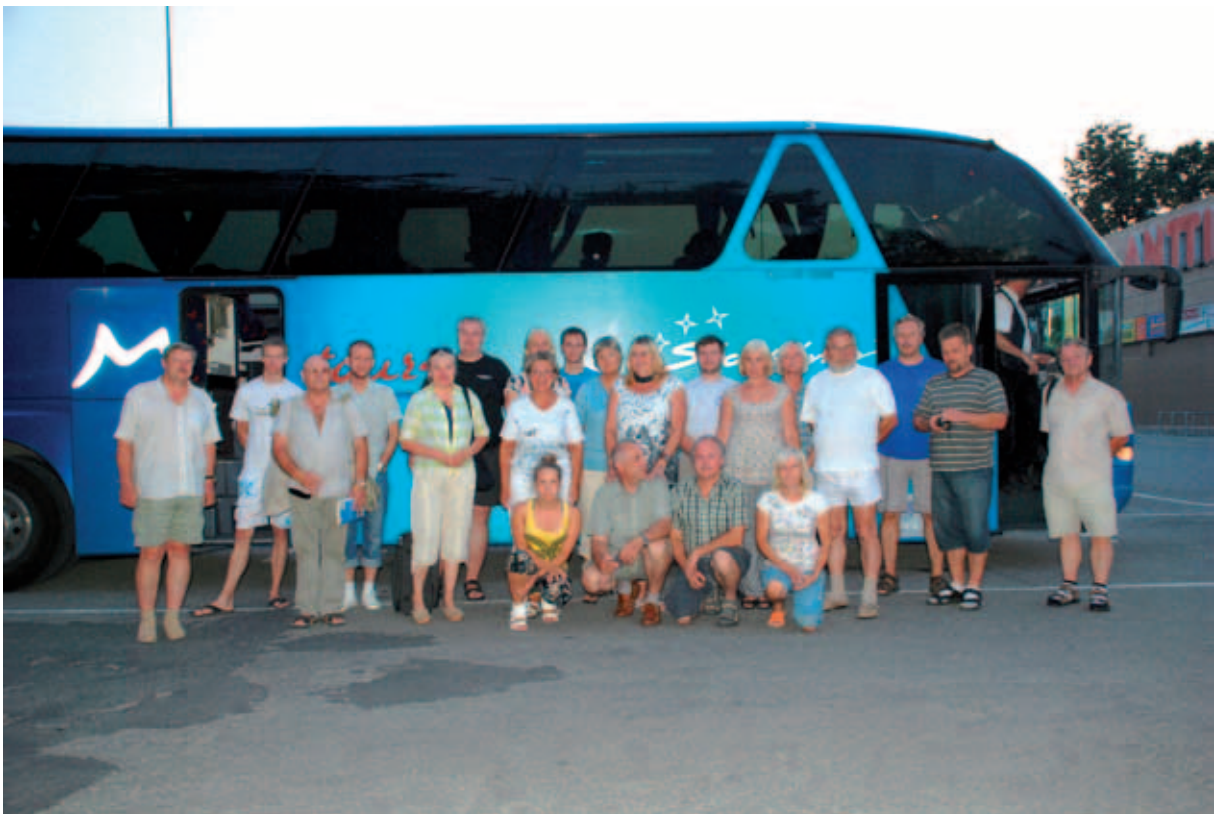
Õppereis Tšehhi 2010.