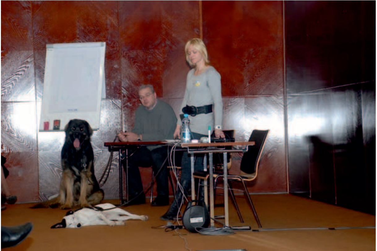
Linnade-valdade päevad – sotsiaaltöö ja kohalik omavalitsus.