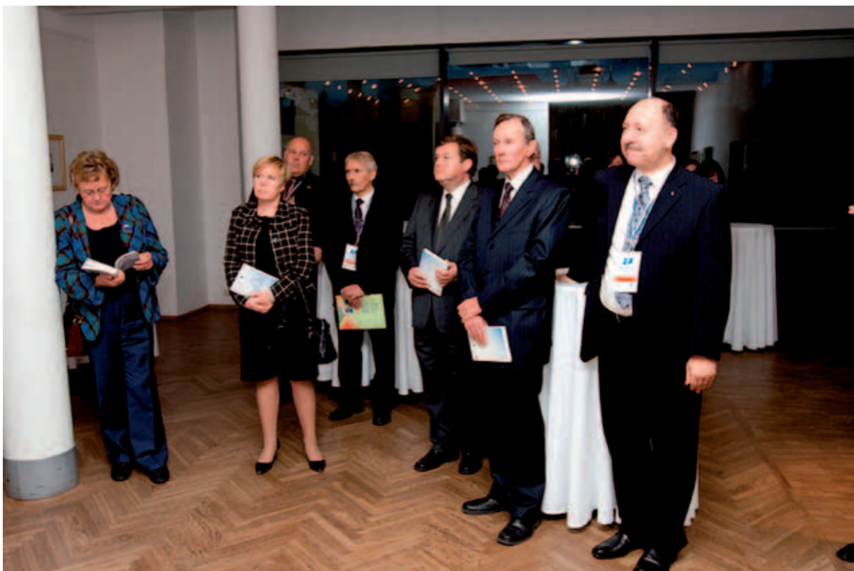
Euroopa Liidu Läänemere regiooni strateegia konverentsi materjalide trükise esitlus 2010.