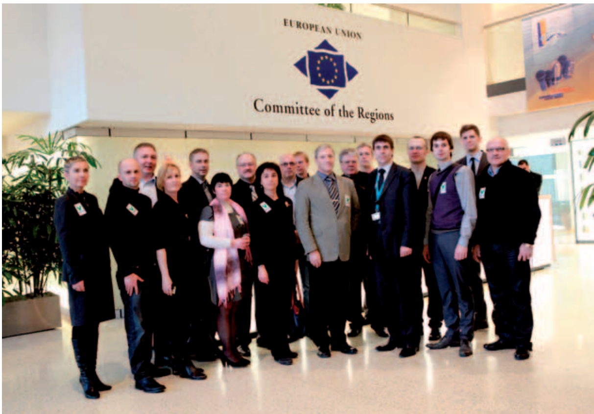
EMOL ja ELL õppereis Brüsselisse 2011.