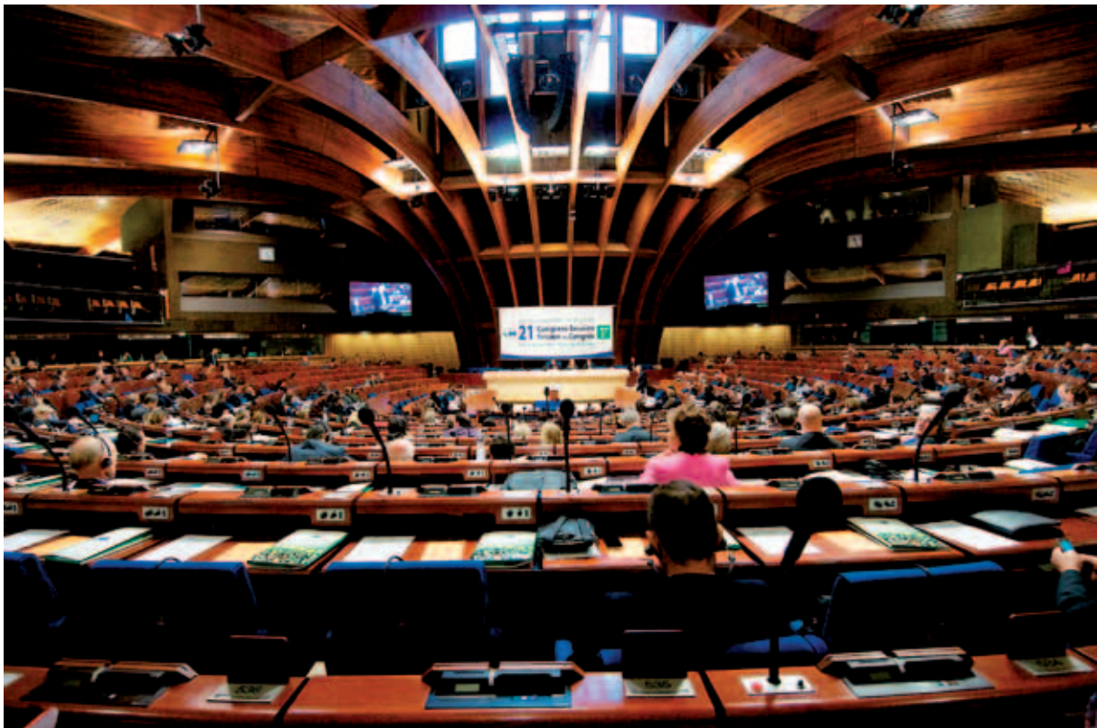
Euroopa Nõukogu Kohalike ja Piirkondlike Omavalitsuste Kongress (CLRAE).