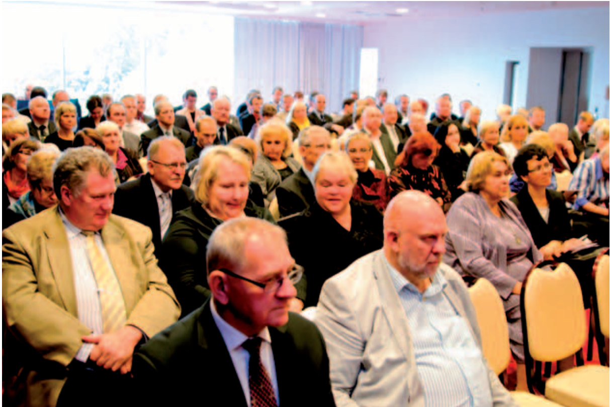
Rahvusvaheline konverents „Eesti Vabariik 100 – kohalik omavalitsus 2018. aastaks“. Eesti Maaomavalitsuste Liit – 90.