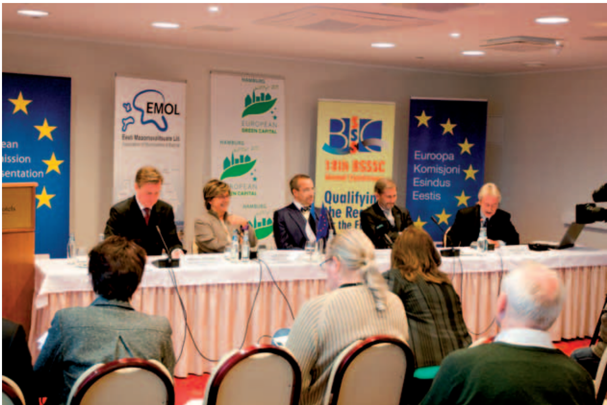
Mr Johannes Hahn, Euroopa Komisjoni volinik. Ms Mercedes Bresso, Regioonide Komitee president.