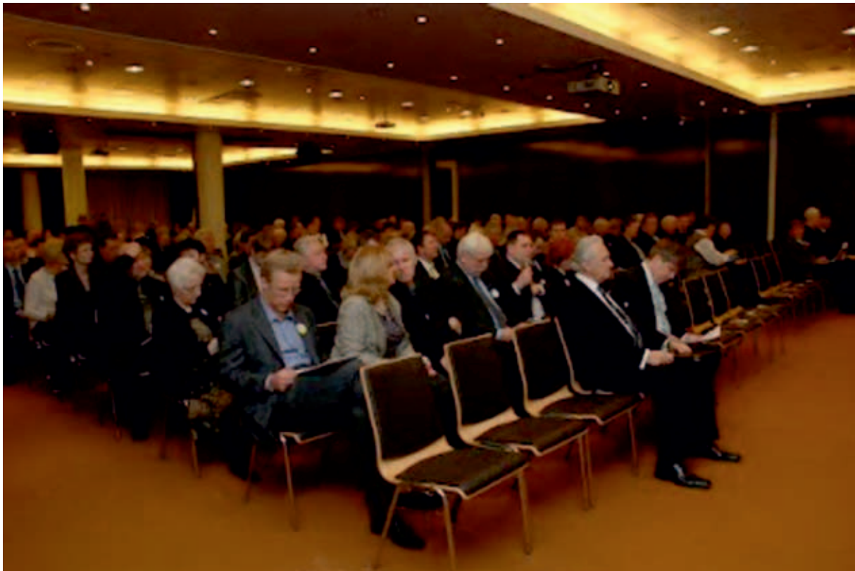
Linnade ja valdade päevad 2012 – kohaliku omavalitsuse arengueeldused.