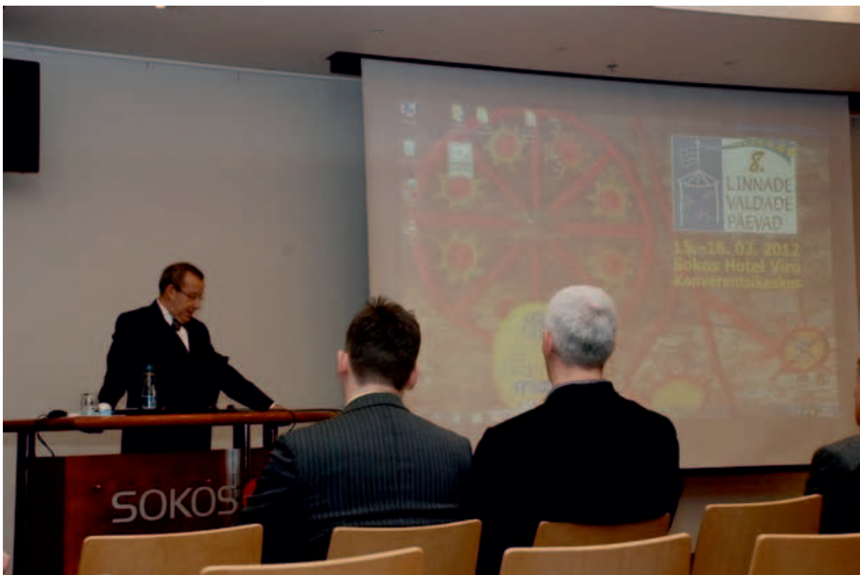
Linnade ja valdade päevad 2012. Vabariigi Presidendi avakõne. President Ilves: „Riik ei saa riigist ära kaduda.“