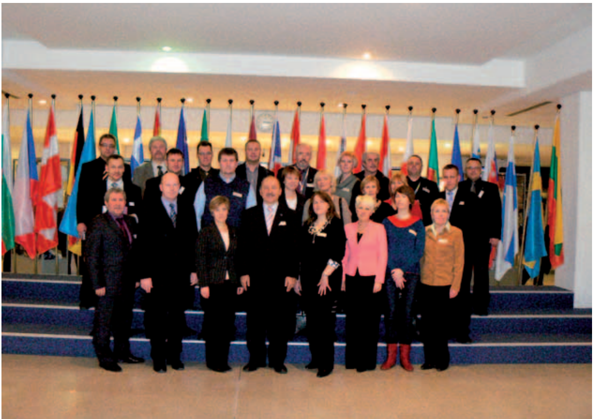
Öppereis Brüsselisse 2009.