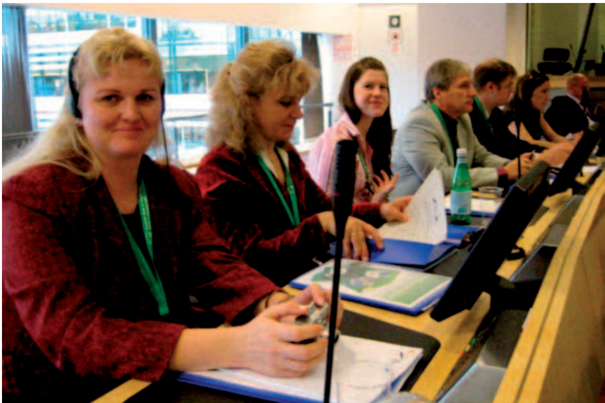
Open Days, Brüsselis 2009.