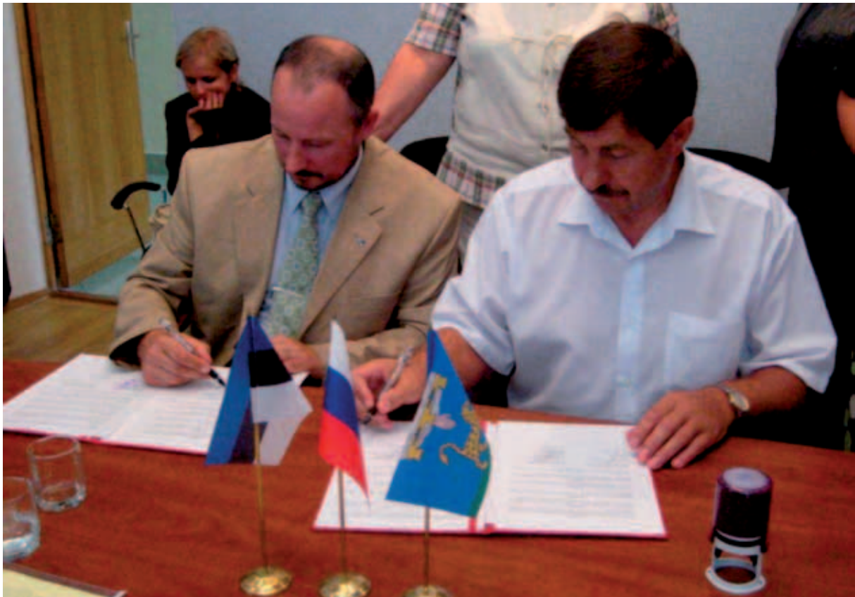
Koostöölepingu allkirjutamine Eesti Maaomavalitsuste Liidu ja Vene Föderatsiooni Pihkva oblasti munitsipaalüksuse „Pihkva rajoon“ vahel 2009.