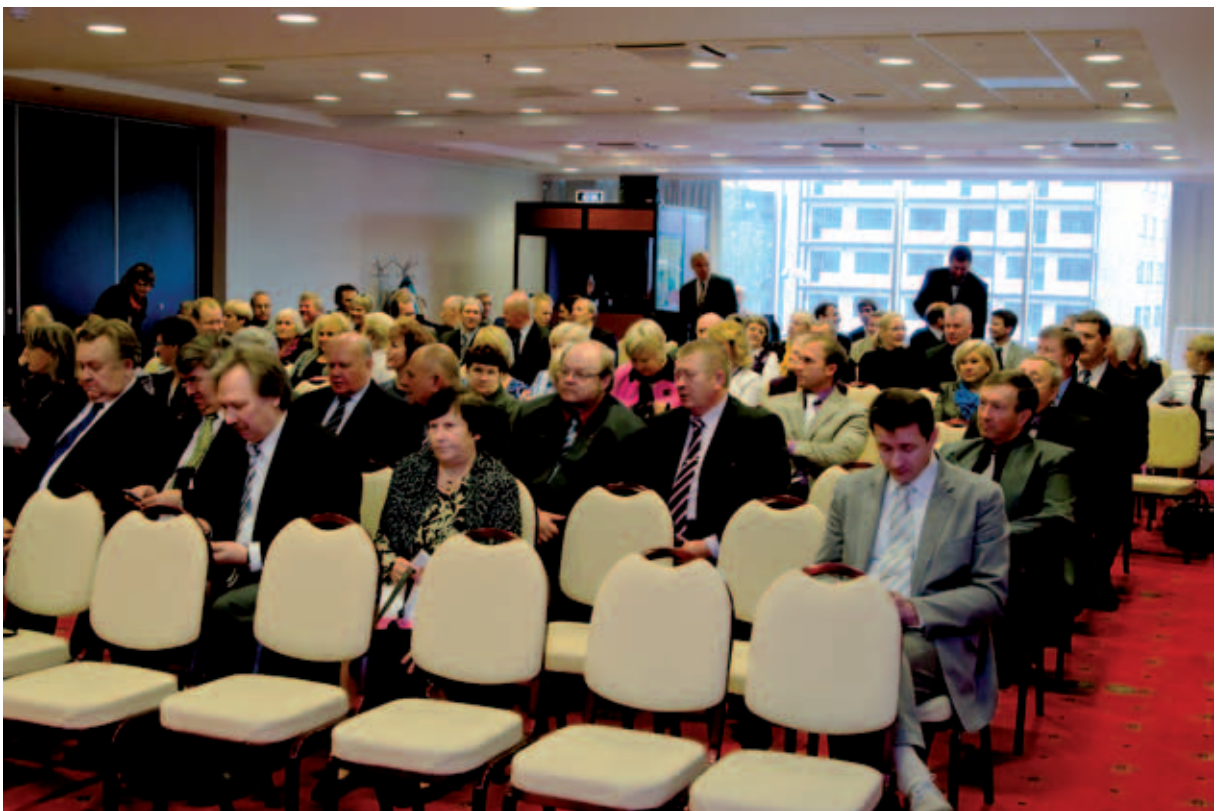
Rahvusvaheline konverents „Eesti Vabariik 100 – kohalik omavalitsus 2018. aastaks“. Eesti Maaomavalitsuste Liit – 90.