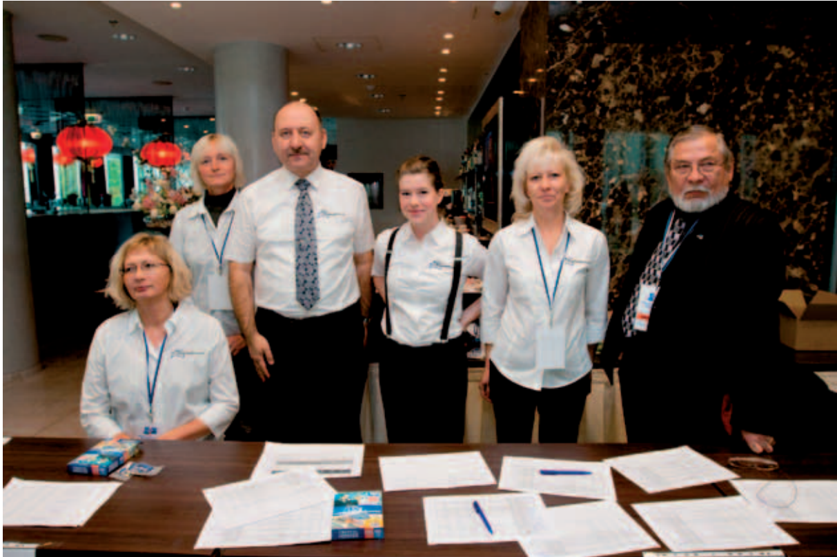
EMOLil on võimekus korraldada ka rahvusvahelisi konverentse ja pressikonverentse. BSSSC aastakoosolek 2010 ja pressikonverents.