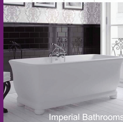
Imperial Bathrooms G3S