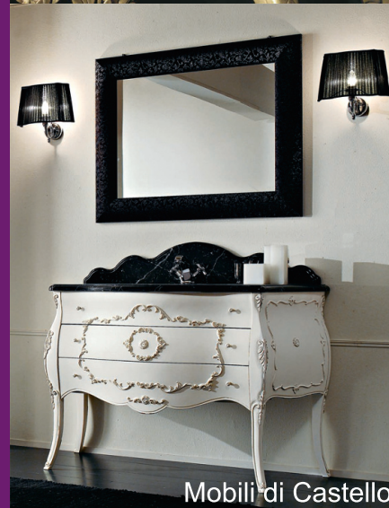
Mobili di Castello Karol