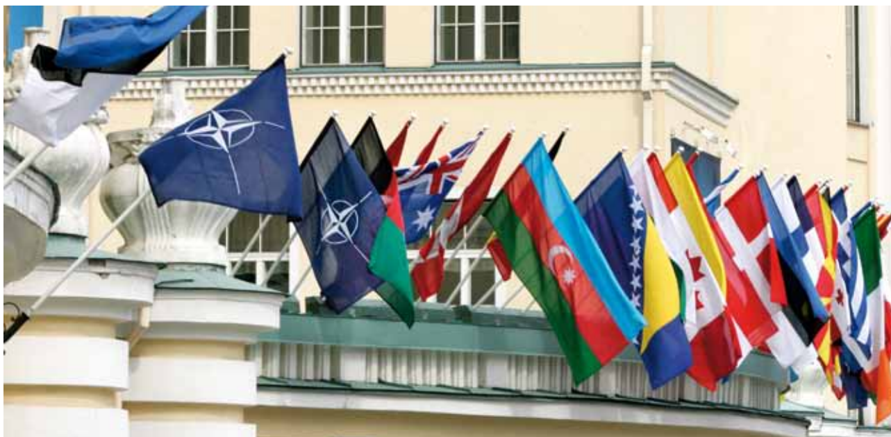
22.-23.04.2010 Tallinnas toimunud NATO välisministrite mitteametlik kohtumine