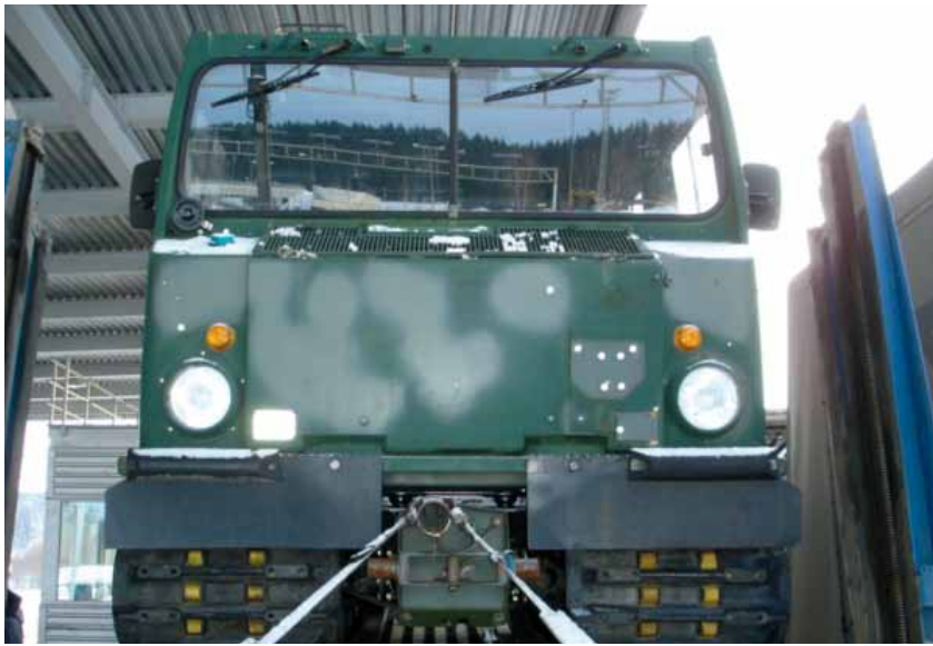
Rootsist läbi Eesti Venemaale toimetada üritatud sõiduk BV 206

26 alustatud kriminaalasjast lõpetati neljal juhtumil menetlus seoses avaliku menetluse puudumisega ning isikud pidid tasuma kohustusliku maksena riigituludesse kokku 397 000 krooni. Väikseim makse oli 500 krooni, suurim 200 000 krooni.