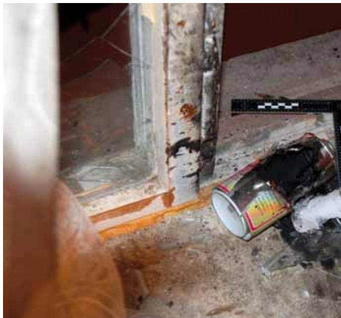
Vaid 2 grammi lõhkeainet sisaldanud detonaatori plahvatuse tagajärjed. Sellise detonaatori plahvatusega inimese käes kaasneks tõenäoliselt ühest või mitmest sõrmest ilmajäämine