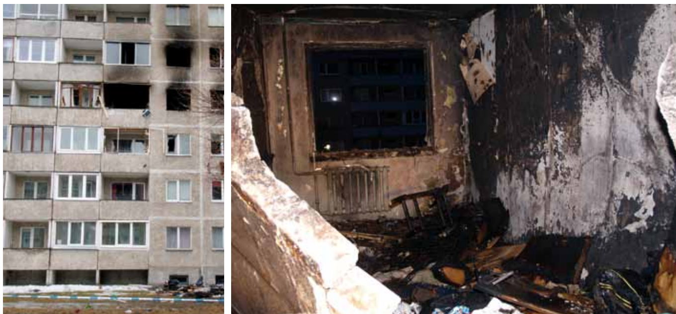
Tallinnas Kuldnoka tänaval toimunud plahvatuse tagajärjed