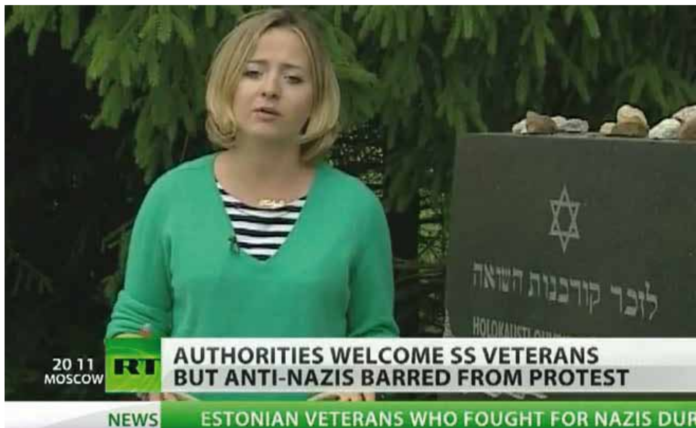
Telekanal Russia Today Sinimägede kokkutulekut kajastamas

tajast ja okupatsioonidele osutatud vastupanust kui natsismi ilmingust. 17 aastat on toimunud Virumaal Sinimägedes endiste Teise maailmasõja rindevõitlejate mälestusüritused – nii nagu neid peetakse kõikjal maailmas. Seekord oli Sinimägedes varasemate aastatega võrreldes kohal suurem hulk Venemaa meedia esindajaid. Rahulikult ja ilma korrariikumisteta toimunud kokkutulekust ja piketist maaliti Venemaa kanalite vahendusel pilt kui Eesti võimude poolt toetatavast uue natsismilaine puhangust ja räigest ajaloo ümberhindamisest. Reportaažid haagiti hiljem veel omakorda kokku mitme teise Eestit natsiriigina kujutava kajastusega, loomaks pidevat vastavat fooni. Kahetsusväärsetl asus ka kohalik meedia ilmselget Venemaa aktiivmeedet tugevalt võimendama veel enne, kui kõik oli toimunud ja osalejate tegelik arv