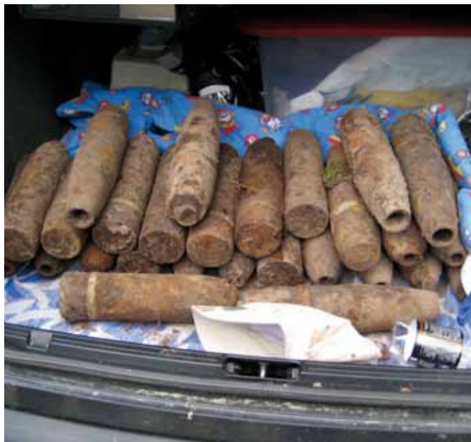
Detektoristidelt ära võetud Teise maailmasõja aegsed lõhkekehad

mille oli kraapinud Harjumaal metsast välja kaevatud mürskudest. 29.01.2010 kaitsepolitseinike teostatud menetlustoimingu käigus lõhkeaine ja 15 tulirelva padrunit konfiskeeriti.