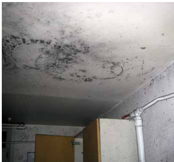
Lõhkeaine pliidi alla viskamise tagajärjed

sõja aegse käsigranaadi RG-42 korpus koos selles olevate trotüülitükkidega, revolver, padruneid ja püssirohtu. Hilisema menetluse käigus andis Grigori vabatahtlikult välja veel 15 elektridetonaatorit ja 8 jahipüssipadrunit.