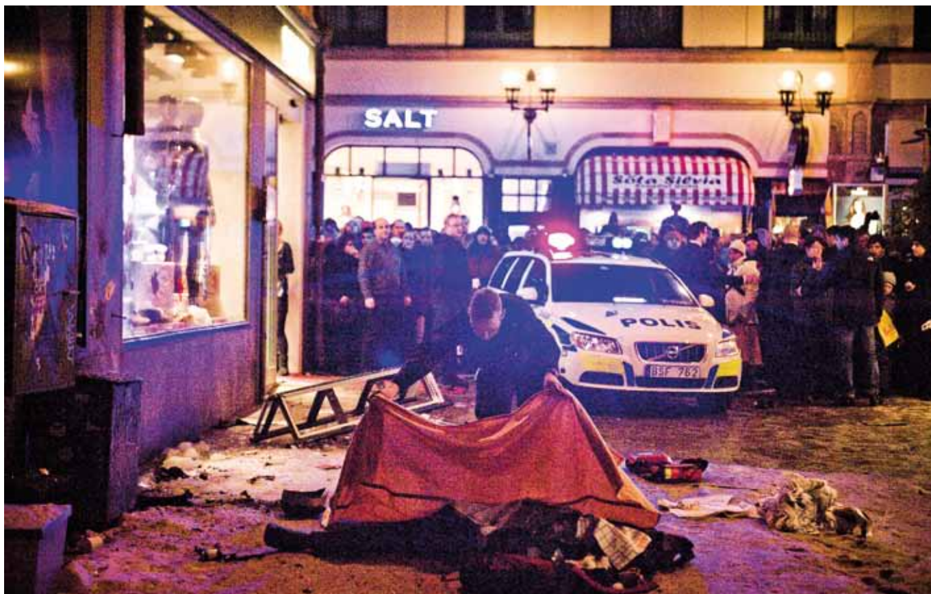
Terrorioht ei ole midagi kauget. 2010. aasta terrorirünnak Stockholmis