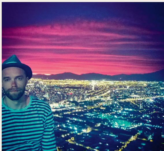
Üleval Santiago südames, all grillitud kaheksajalaga Taiwanil.