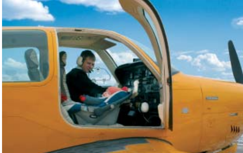
Projekti Choises and Balance piloot – paindlikud valikud ja tasakaal.