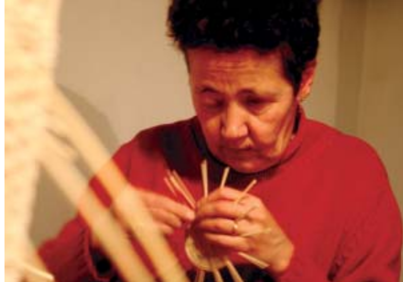
Kuressaare Puuetega Inimeste Koda, vanaproua vitstest korvi punumas.