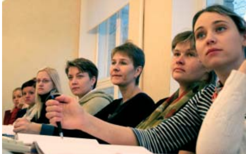
Noored ettevõtlikud emad Saaremaa Õppekeskuse koolituse avaloengul.

Kodulehekülg: www.wefriends.hiiumaa.ee ; www.tuuru.edu.ee