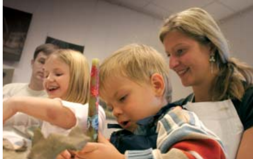
Kunstring Tartu Rahvaülikooli studios. Terviklikel peresuhetel püsib terviklik ühiskond.