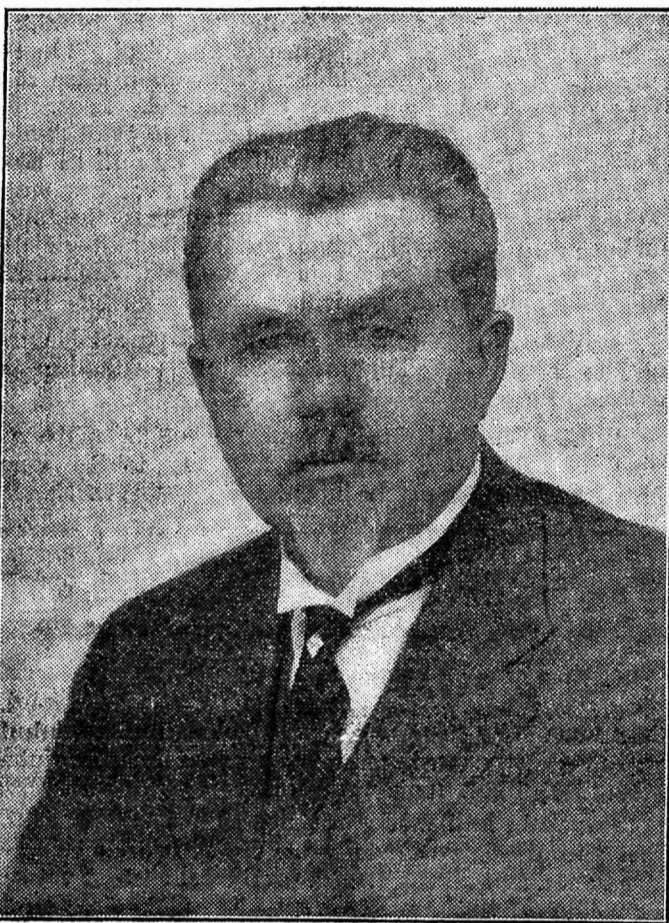
Erum-kontradmiral JOH. PITKA. Merejõudude Juhataja Eesti Vabadussõjas.

Vabadussõda on seega tähtsam ja enamõigustatud kõigist sõdadest, et temale püstitada monumente. Ei ole nende püstitamine tarvilik meile, kes oleme Vabadussõjast osa võtnud, — meile jätkub meie õilsatest mälestustest meie haudadeni; Vabadussõjast osavõtjad ei loe neid eneste isiklikkude teenete tähisteks, vaid