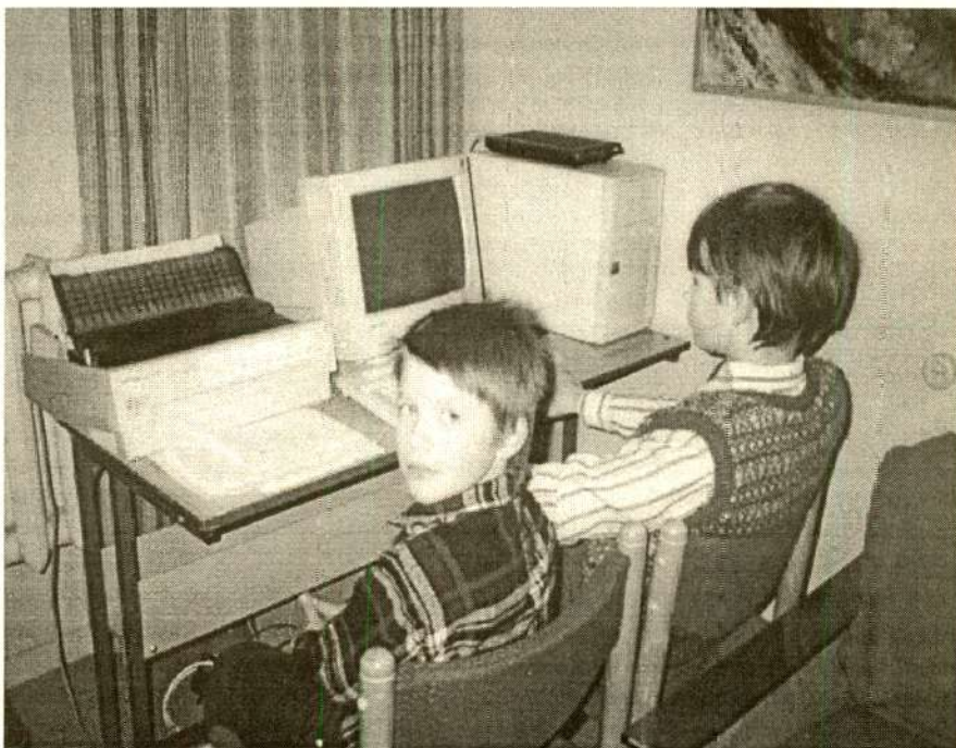
Noored lugejad Vastemõisa raamatukogus Viljandimaal.

Ühtse, juba kujunemas oleva raamatukoguvõrgu tsentraliseerituse määr võib olla erinev, ülesandeid ja kohustusi saab jagada mitmel alusel. Lõppkokkuvõttes on otsustav aga raamatukogude valmisolek koostöök. Millises ulatuses ollakse valmis oma funktsioone, ka iseseisvust, otsustamisõigust ja huvisid teistele loovutama. Raamatukogud peavad enda jaoks ja ka üheskoos otsustama, milliseid töid on otstarbekas teha koos, milliste ülesannete puhul nähakse optimaalsena ühiskondlikku organisatsiooni, ERÜ-d, mõnd omailoodud mittetulundusühingut, ELNET Konsortsiumi ja milliste puhul on kõige õigem otsida puhtkommertslikul alusel tegutsijat. Riikliku kultuuri- ja hariduspoliitika väljatöötamisel ja elluviimisel peaks raamatukogud oma traditsioonilist ametkondlikkust, iseolemist suutma vahendada. On kaks mõistet, mis vastuolulisena suunavad raamatukogude arengut – need on koostöö ja kogude terviklik areng. Vähemalt paari lähema aasta jooksul, integreeritud infosüsteemi sisulise juurutamise ajal on ELNET Konsortsiumil selles pingeväljas oma kindel roll täita.