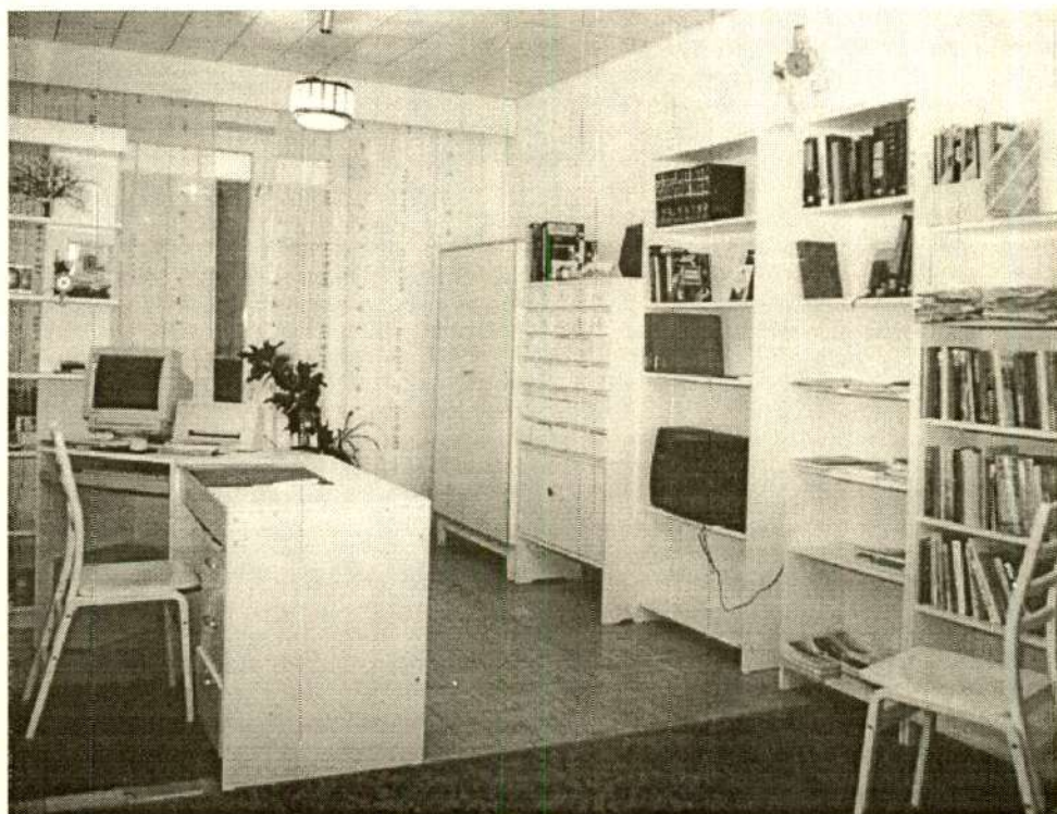
Voka raamatukogu Ida-Virumaal.