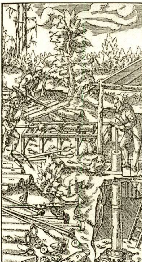
Vee väljapumpamine kaevandusest.

Gregorius Agricola graviüürid raamatust "De re metallica" (Basel, 1556).