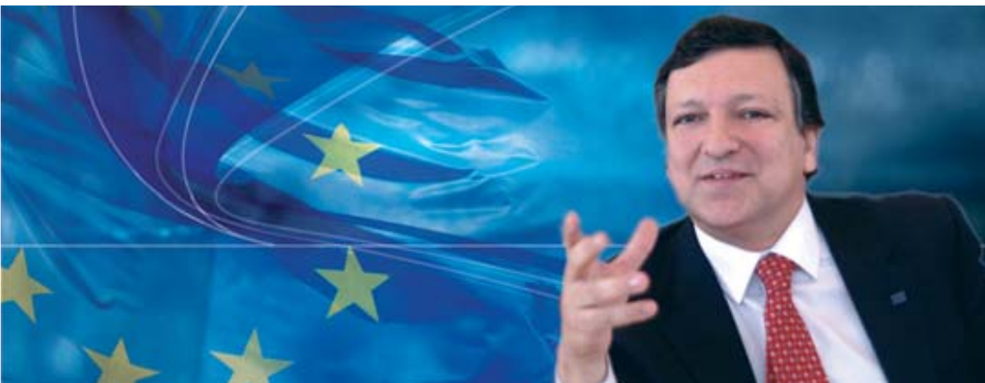
José Manuel Durão Barroso Brüssel, 25. jaanuar 2006