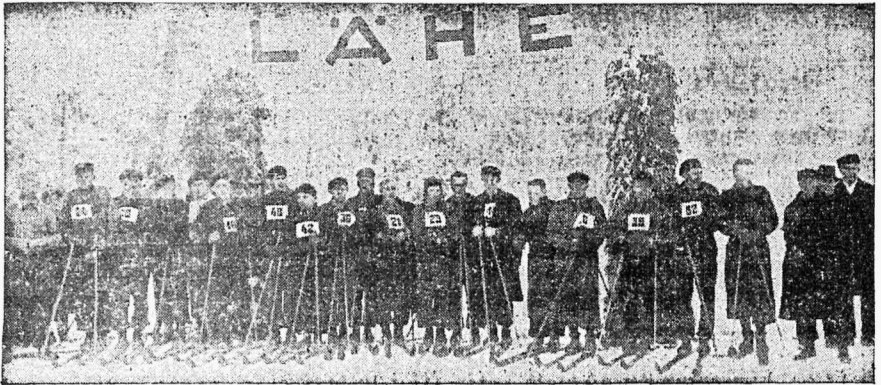
Põllumajandusliikude koolinoorte suusavõistlustest osavõtjad Jänedal

inspektor hra J. Ümarik, toonitades, et see on esmakordne, kus noored põllumajandusliikudest kutsekoolidest asuvad võistleva puht sportlikul võistlus-alal, kuna seniajani peetud vaid oskusvõistlusi lüpsmises, kõnelemises ja loomade hindamises. Lootes, et säärased võistlused aitavad kaasa noorte võistlus- innu ja töömeeleolu tõstmisel ning on sellistena tervitatud ja peaksid igal talvel korduma.