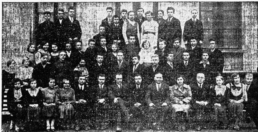
Saaremaa maanoorte juhtide kuuaajalistest kursustest osavõtjad ühes lektoritega.

Möödunud talvel korraldati arvurikkaid referaatkoosolekuid ja arutati läbi suviste tööde aruanded. Korraldati ka