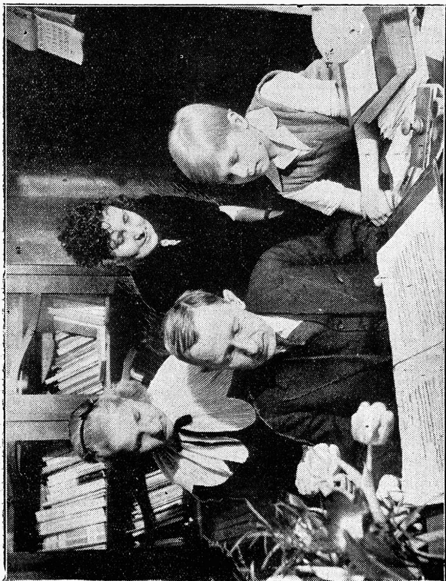
A. H. Tammsaare oma perekonna keskel.