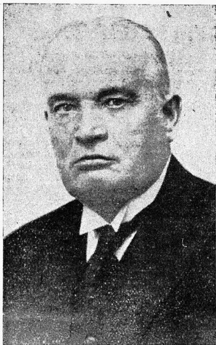
Riigihoidja K. Päts. Saab 23. veebruaril 64 aastaseks.