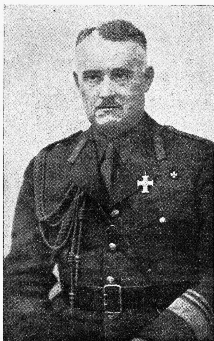
Sõjavägede ülemjuhataja kindral J. Laidoner. Sai 12. veebruaril 54 aastaseks.

palju hellitavaid küsimusi ja nad ei looda head õnne, mis kannaks nende käetlatusse teenimatu valikuvõimaluse: milline kink sulle meeldib, see või too? Nad teavad, et reaalne tõelikkus nõuab neilt palju, nõuab neilt tugevust; kuid nad ei karda seda. Nad valmistuvad selle jaoks. Raske ega vali pole see, millest saadakse üle. Rasketele küsimustele astuvad nad vastu teadmises, et selliseid küsimusi ei esitata nõrkadele.