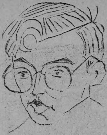
R a j a l a s i