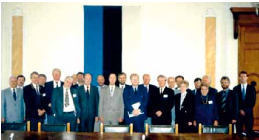
Rahvusvahelisest töökaitsekonverentsist osavõtjad peaminister Mart Laari (keskel) vastuvõtul Toompeal.

7.–8. septembril 1993 toimus Tallinnas rahvusvaheline töökaitsekonverents ja näitus „75 aastat töökaitset Eestis“, millest võtsid osa Rahvusvahelise Tööorganisatsiooni (ILO) ning Rootsi, Soome, Norra, Taani, Islandi, Leedu ja Läti töökaitse juhtivametnikud, samuti Eesti selle ala juhtivteadurid ja spetsialistid. Konverentsi korraldajaid ja külalisi võttis Toompeal vastu peaminister Mart Laar.