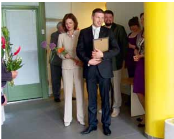
Sotsiaalminister Hanno Pevkur (keskel) on väisanud mitmeid Tööinspektsiooni üritusi.