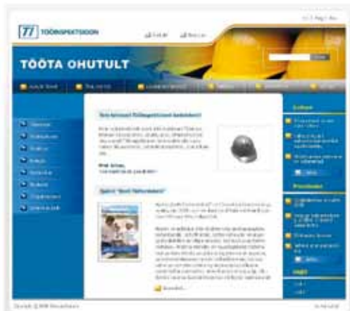
Tööinspektsiooni veebileht 2006. aastal.

Kodulehel leidis teavet töökeskkonna kujundamiseks ja ohutumaks muutmiseks nii tööandjale kui ka töötajale, samuti töökeskkonda ja töösuhteid käsitlevad seadused ja määrused, standardid, juhendmaterjalid, selgitused, kampaaniate tutvustused, töökeskkonda ja inspektorite tööd puudutav statistika alates 1997. aastast.