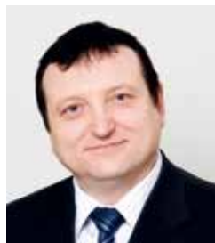
Lääne inspektiooni juhataja Üllar Kallas tuli Tööinspektiooni 1992. aastal.