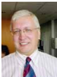
Lõuna inspektiooni juhataja Ülo Ustav on Tööinspektioonis ametis 1991. aastast.