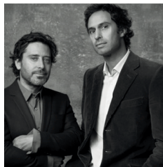
BELL LAMP (paremal) Barber & Osgerbylt (fotol) on inspireeritud Louis Vuittoni ikoonilisest pudelikujulisest kotist Noè.