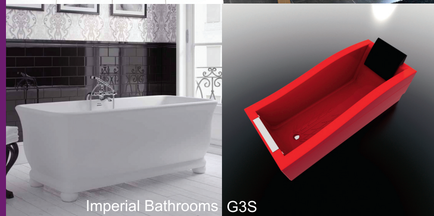
Imperial Bathrooms G3S