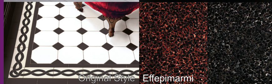
Original Style Effepimarmi