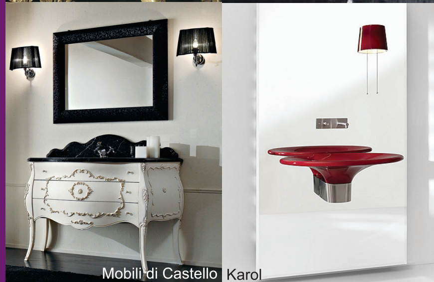
Mobili di Castello Karol