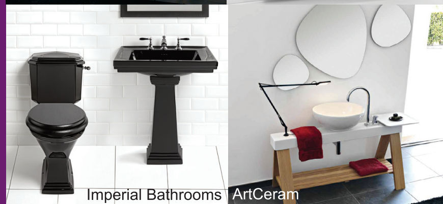
Imperial Bathrooms ArtCeram