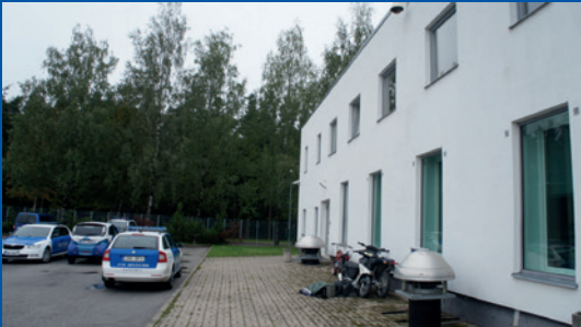
Eesti. Eraldi sissepääs Tartumaa Ohvriabikeskuse hoone tagaküljel.

Tartumaa Ohvriabikeskus Eestis on loonud eriti traumeeritud lastele hoone tagaküljele eraldi sissepääsu. Mõnes Soome kohtusaalis on samuti eraldi sissepääsud ning eraldi sissepääsud ja ooteruumid on ka Ühendkuningriigi kohtutes kõrgelt hinnatud.