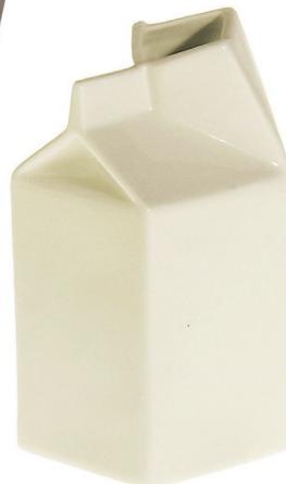
Keraamiline piimakann. Seletti.