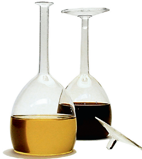
Õli- ja äädikanõud. Jansen & Co.