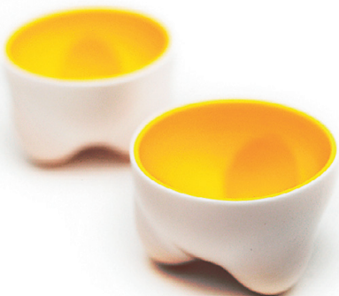
PVCst ühemunapüksid. Design Glut NYC.