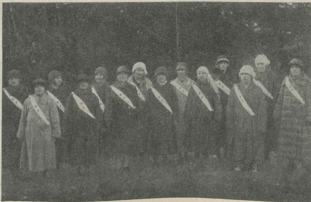
Kõige esimesi Harju Naiskodukaitse liikmeid.

Meie suurimaks ning raskeimaks ülesandeks on olnud 10-ne aasta vältel tulude hankimine nii enda kui kaitseliidu tarviduseks. Seks otstarbeks on korraldatud pidusid, loteriisid, korjandusi ning ka äri- lisi ettevõtteid. Need summad pole väiksed, üle 14 miljoni senti on hankinud virgad Harju naiste käed. Nende veeringute kogumine senti- ja kroonide haa-