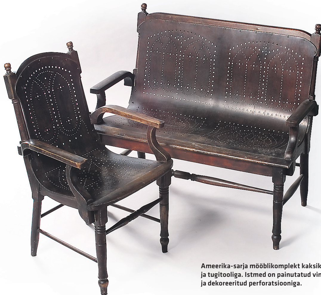
Ameerika-sarja mööblikomplekt kaksikistme ja tugitooliga. Istmed on painutatud vineerist ja dekoreeritud perforatsiooniga.

nukivineeri ja rahvuslikus stiilis mööbli tootmine. Ettevõtte turustas oma toodangut Suurbritannias, Prantsusmaal, Belgias ja Itaalias.