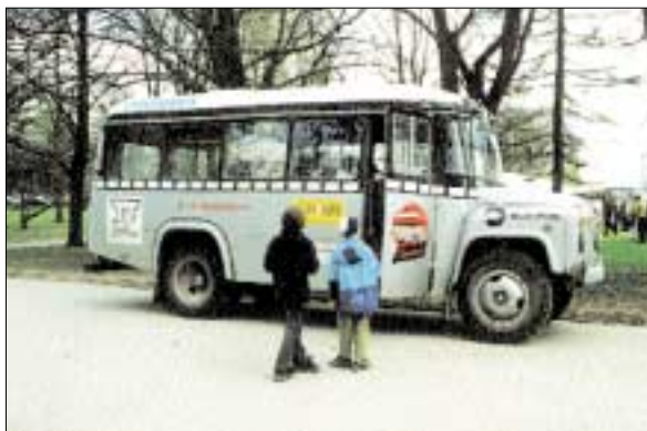
Kinobuss, mis näitas programmi alustuseks kroonikakaadreid Filmiarhiivist

Seega oli 2002. aasta Eesti filminduse juubeliaastaks. See ajendas hoidlast uuesti välja otsima lühikese filmikatke (kaks minutit), millel samast ajast pärit ülesvõtte lennudemont-ratsioonist. Filmi algusaastatel kasutati põlemisohtlikku nitraatalusel filmilinti, mille säilivus on ebastabiilne. See filmikatke oli staadiumis, kus filmi kokkutõmme oli nii suur, et tavavahenditega ei olnud seda võimalik läbi vaadata juba 1970. aastatel. Tänapäevane digitaaltehnika tuli aga appi ja filmikatke sai Digital Film Finland OY-s ümber salvestatud. Koos lennundusajaloolastega püüdsime selgitada, kas tõesti on tegu esimese, J. Pääsukese poolt filmitud episoodiga. Esialgul jäi domineerima arvamus, et siiski mitte, kuna panoraam viitas Tallinnale, kuhu S. Utotškin pärast Tartut tuli. Uurimistöö käib edasi, kuid sensatsioon jäi ära. Tänu sellele, et ka "Pealtnägija" asjast huvitus, sai lai vaatajakond teavet meie filmiajaloo algusest.