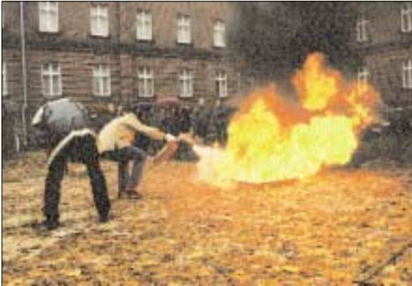
Tulekustutite käsitlemise õppus

Jätkusid tööd arhiivi turvalisuse tõstmisel. Koostati ohuplaan, kaasajastati evakuatsiooniskeemid, toimusid esmaabi andmise algkursus ning tulekustutite käsitlemise õppused. Paigaldati nõuetekohane ohumärgistus ja standardvarustus (tulekustutid, kustutustekid, transpordikastid, esmaabivahendid jm).