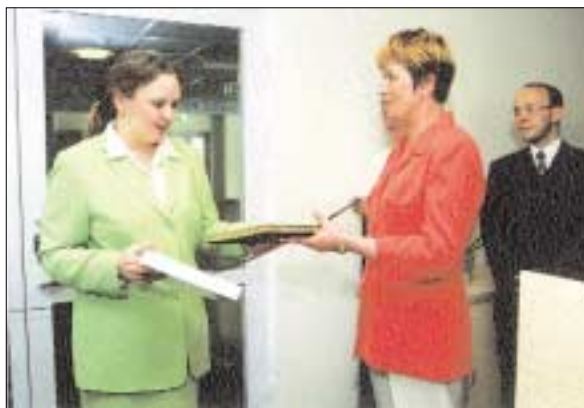
... ja pidulikult avamisel 17. mail 2002