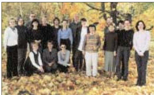
Kursusest "Records Management" osavõtjad

Koolitussüsteemi käivitamise esimese sammuna oli vaja koostada töötajate võimete ja oskuste arendamiseks Rahvusarhiivi eesmärkidest ning töötajate vajadustest lähtuv süsteemne koolituskava. Esimene kava valmiski 2001. aasta kevadel (kinnitatud 20. aprillil 2001 riigiarhivaari käskkirjaga nr 58), see sisaldas planeeritud sisekoolitusi üheks aastaks. Aasta 2002 sai endale uue, järjekorras teise koolituskava (kinnitatud 1. märtsil 2002 riigiarhivaari käskkirjaga nr 54). Koolituskavas planeeritud kursused hõlmasid nii Rahvusarhiivi töötajate poolt läbiviidavat täiendõpet oma kolleegidele (nn majasisene koolitus) kui ka tellitud koolitust (nn grupikoolitus). Lisaks sisekoolituste korraldamiseks planeeritud ressurssidele leiti rahalisi vahendeid ka avatud koolituste tarbeks, mis võimaldas töötajatel osaleda spetsiifilistel tööalastel õppustel. Kahe aasta jooksul on selliseid koolitusi olnud 120.