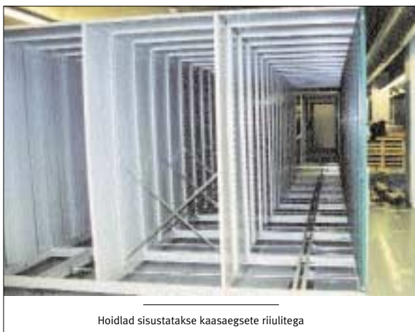
Hoidlad sisustatakse kaasaegsete riulitega

Tänu pikalt ja põhjalikult ettevalmistatud kolimiskavale oligi võimalik kohe, kui Madara tänava hoidlad olid riulitaga sisustatud, alustada mastaapset kolimist. Ligi veerand Riigiarhiivi säilikutest said uue asukoha. Esimesteks asukateks said projektasutuste dokumendid (kokku 65 fondi, 122 394 säilikut), mis seni asusid rendipindadel.