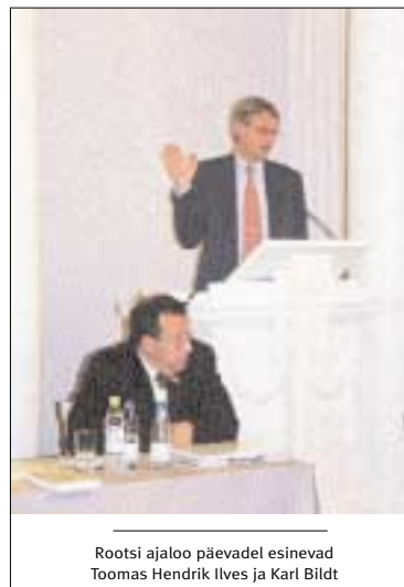
Rootsi ajaloo päevadel esinevad Toomas Hendrik Ilves ja Carl Bildt