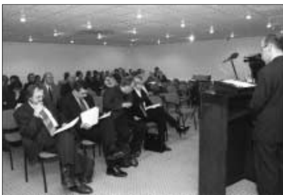
Konverents "Filmiarhiiv kui osa filmikultuurist" Rahvusraamatukogus 17. jaanuaril 2001.

Veebilehe olemasolu on oluliselt avardanud võimalusi suhtlemiseks avalikkusega: eksponeerime regulaarselt fotonäitusi ja vahetame nii filmide kui helisalvestiste näiteid, nõuannete rubriigis saab üldisi näpunäiteid audiovisuaalsete dokumentide säilitamise ja korrastamise kohta jne.