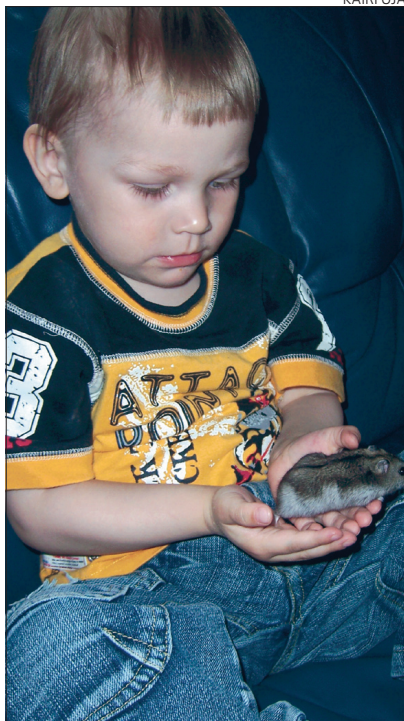
Hamstrit tuleb hoida õrnalt.

Mõte tundus esmapilgul üsna arulage – töid kodus üleearugi ning ka lapsega tegu, millal veel aega selle puuri-