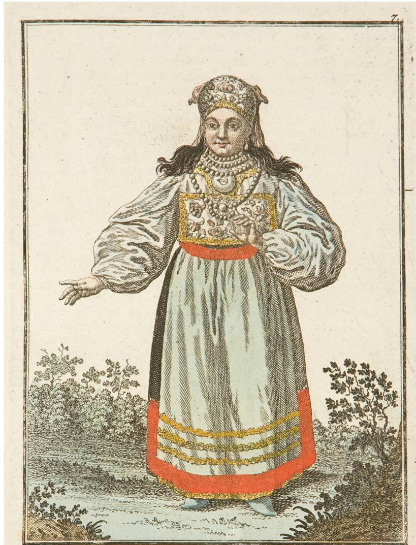
Эстляндская баба съ лица. Eine Estländische Frau vorwärts. Femme Esthoniennne par devant.

Johann Gottlieb Georgi (1729-1802) on 18. sajandil põhjalikult uurinud Vene impeeriumi rahvaste kombeid, riietust, eluolu, uskumusi. Imperaatorliku Teaduste Akadeemia toel kirjastati Sankt Peterburgis saksa- ja venekeelsena ulatuslik uurimus Описание всех обитающих в Российском государстве народов их житейских обрядов, обыкновений, одежд, жилищ, упражнений, забав, вероисповеданий и других достопамятностей , 1799, 1.-4. osa. Väljaandes on esitatud pildid Põhja-Eesti naiste rahvariietest.