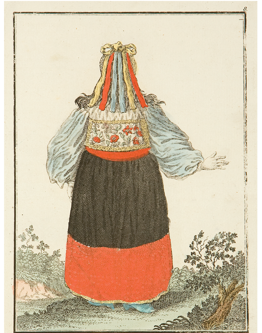
Эстляндская баба съ тыла. Eine Estländische Frau rückwärts. Femme Esthoniennne par derriere.