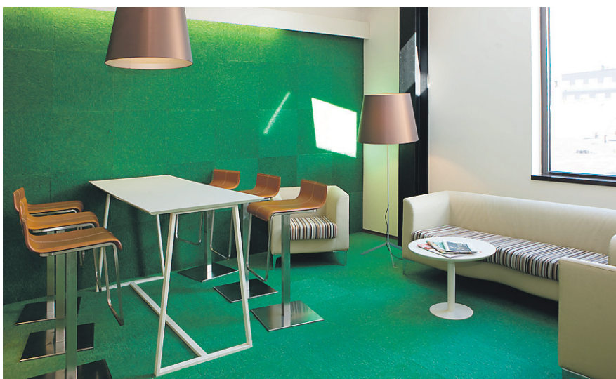
Avatud kontoriosa tegusast toimetamisest saab põigata rohurohelisse kööki peitu tassikest kohvi nautima.