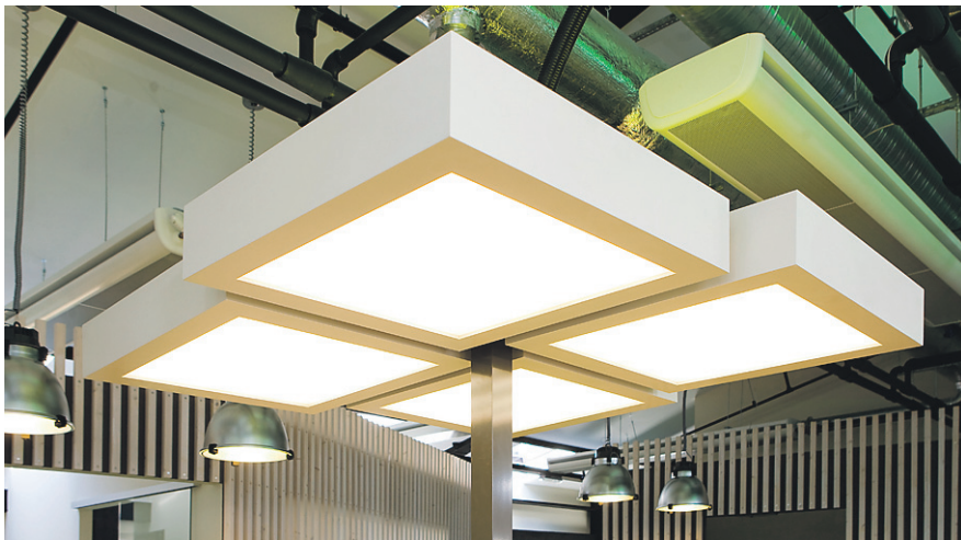
Meelega avatuks jäetud ventilatsiooni- ja kommunikatsioonitorud ning juhtmed loovad koos tehnilistlike valgustitega "tehnilise metsa" meeleolu.