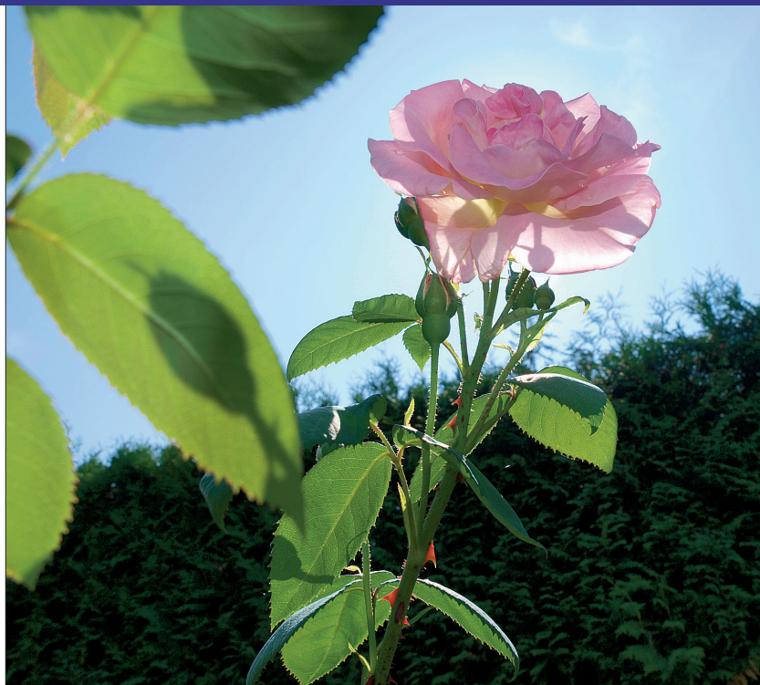
Korduvõitsev pargiroos 'Dr. Eckener'. Suured pooltäidetud õied lõhnavad õrnalt. Kõrgus 1,2–1,5 m.