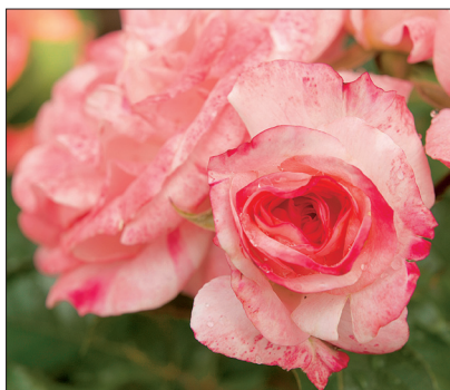
Sordi 'Rosenstadt Freising' kreemvalgetel täidisõitel on punane maaling. Kõrge (0,9–1,2 m) põõsasroos. Õied 2–5 kaupa kobaras. Lehestik ilus läikiv.