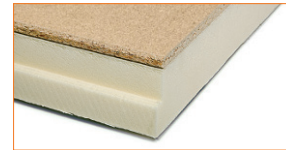
Seinte, põrandate ja lagede seespoolseks soojustamiseks.

SPU Wilhelmi Plaadi mõõtmed: 600 x 2600 mm Isolatsioonipaksus: 30 mm või 60 mm Sulund: poolsulund pikkadel külgedel Kate: pealisplaadiks liimitud 11 mm puitlaastplaat, teisel poolel paberpind.