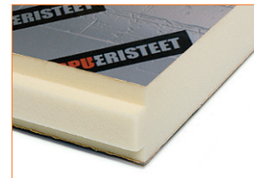
Pööninguvahelae- ja välisseinatariindite ehitamiseks ja remondiks.

SPU Vintti-lita Soojusjuhtivus: lambda design 0,023 W/mK Plaate mõõtmed: 1200 x 2600 mm (70 mm ka 600 x 2600 mm) Isolatsioonipaksus: 70, 90, 120 ja 160 mm Sulund: täissulund pikkadel külgedel Kate: mõlemal poolel difusioonikindel alumiiniumlaminaat