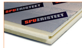
Sauna seinte ja lagede ning niiskete ruumide laepindade isoleerimiseks. Ka muude siseruumide seina- ja laetarinditesse koos laudvooderdusega.

SPU Sauna-Satu Soojusjuhtivus: lambda design 0,023 W/mK Plaadi mõõtmed: 600 x 1200 mm Isolatsioonipaksus: 30 mm Sulund: täissulund kõigil külgedel Kate: alumiiniumlaminaat plaadi mõlemal poolel