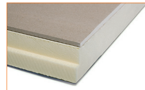
Seinte ja lagede seespoolseks soojustamiseks.

SPU Anselmi Plaadi mõõtmed: 600 x 2600 mm Isolatsioonipaksus: 30 mm või 60 mm Sulund: poolsulund pikkadel külgedel Kate: pealisplaadiks liimitud 9 mm õhemate servadega kipsplaat, teisel poolel paberpind.