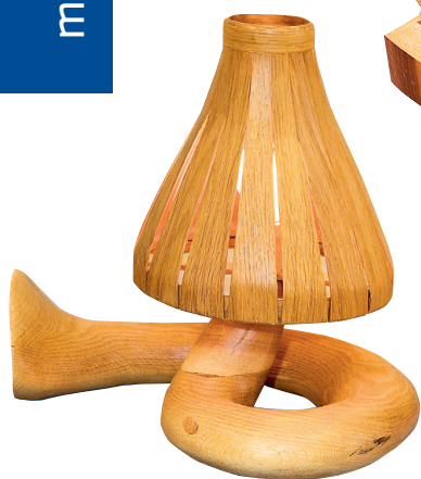
Lualamp "Ekskrementaalmuusika" meenutab igale uudistajale erinevat pilli.