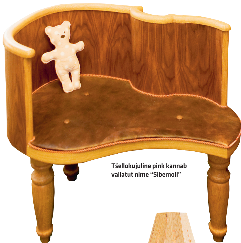
Tšellokujuline pink kannab vallatut nime "Sibemoll"