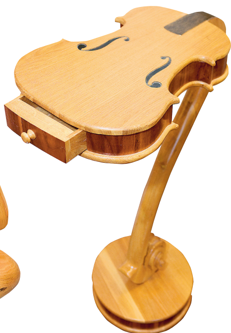
Laud "Viola" oli Heimi Soobiku esimene töö.