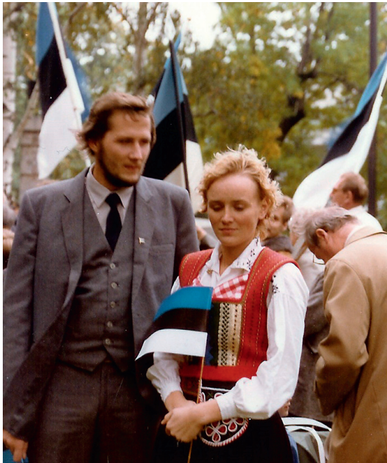
Pagendusaastad. Meeleavaldusel Los Angeleses koos väliseestlastega.

Kähra tegid lapsevanemad kogu jõuga. "Vihkasime Nõukogude okupatsiooni ega tahtnud enam põõsas istuda. Käisime mööda konverentse, esinesime väliseesti organisatsioonides, lubasime USA-l oma lugu nõukogude korra vastases propagandas kasu-