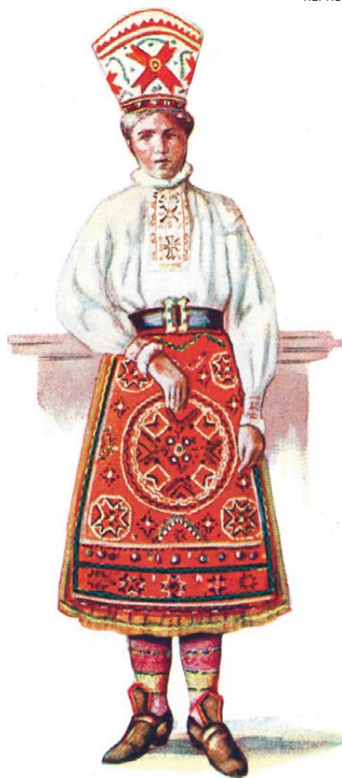
Eesti kaunis rahvariie väärrib tutvustamist.