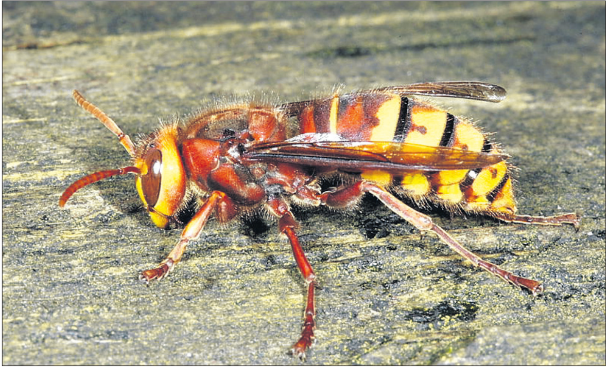
Vapsikult nõelata saamine võib allergikule koguni eluohtlik olla.

Raamatud on saadaval kõigis raamatukauplustes üle Eesti. Tellimine: 680 4444 või klienditugi@lehed.ee