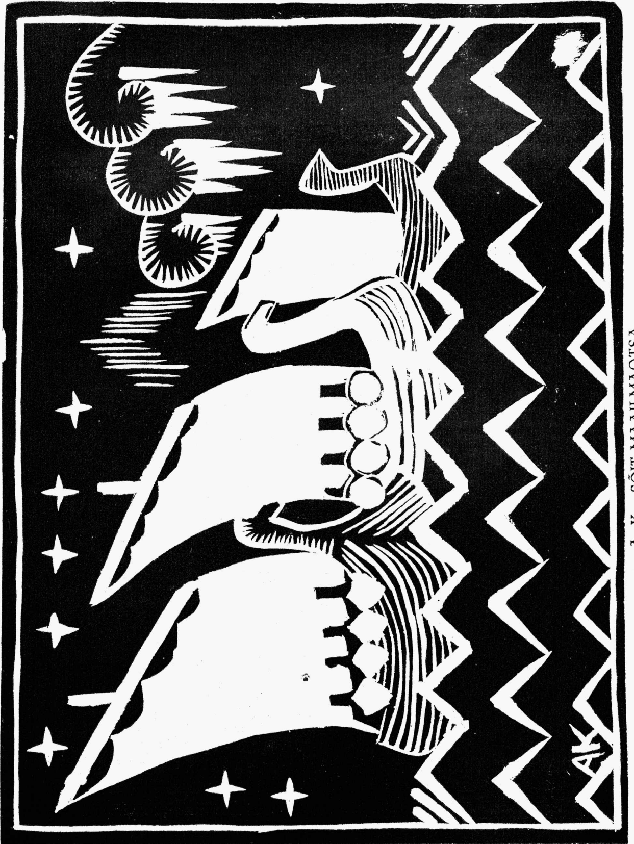
A. K.: SÖIT MAAILMAOTSA.