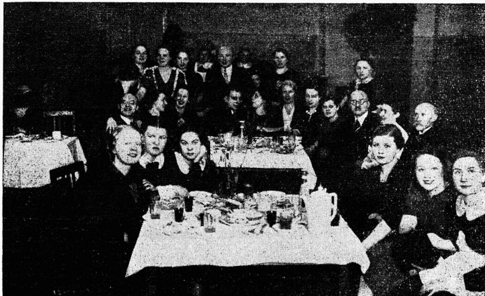
Pilt Vil.-kogu juubelpidustuste lõpuolengust.

TTG Vilistlaskogu 15. aastapäeva pidustused möödusid pikkade pingutatavate eelaskelduste järele tunnustamisväärivalt hästi.