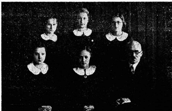
Õpilaspere Esinduse juhatus.