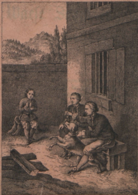
Seppi kartis Ilmmalat ommas süddames ennam kui inimessesje.