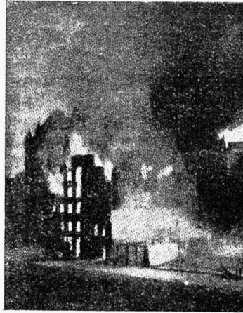
Silmapilk maja põlemisest.

maid maju. Majad, mis kõrvuti asusid, olid 25 meetrit pikad. Üks oli kahekordne ja 7 m. sügav, teine viiekordne ja kümme meetrit sügav. Hooned olid kivist, suuremal oli lift.