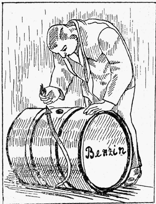
See on enesetapmine kui niiviisi lahtise tulega bensiini vaadi juure minnakse. Bensiin plahvatab hõlpsasti.

Igapäevaga kasvab bensiini, piirituse ja laki tarvitus tööstuses, mis suurendab ka tulehädadohtu ettevõtetes. Tule kardetavate vedelikkudega võib talitada ainult päevavalgusel — või välis- ehk elektrivalgustusel, kuid ei mingil tingimisel tule läheduses ehk lahtise küünlatule valgusel.