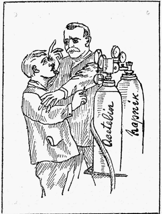
Eemale õli ja rasvaga hapniku aparadi juurest. Need ained võivad teostada plahvatust.

Kogu vabriku tööliiskonda ja teenijaid tuleb tutvustada mitmesuguste tule süttimiste põhjustega, näiteks keemiliste põhjustega. Õliste ja rasvaste jätiste palavaks minemine ja süttimine, samuti saepuru süttimine jne. Sellepärast tuleb valjult nõuda, et masinate puhastamiseks tarvitusel olnud õlised lapid, puuvillad jne. tulevad ainult sellekohastesse kindlatesse hoiukohtadesse visata.