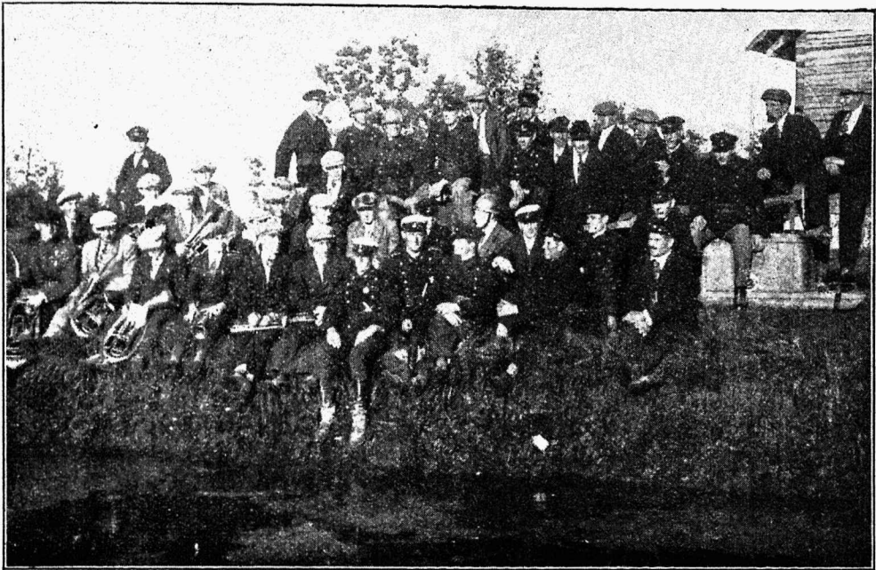
Rakke tuletõrje ühing.

Kui kohalik politseiametnik ühe päeva jooksul ei suuda kindlaks teha tuleal- guse põhjust, kutsutakse abiks tulekaitse spetsialist.