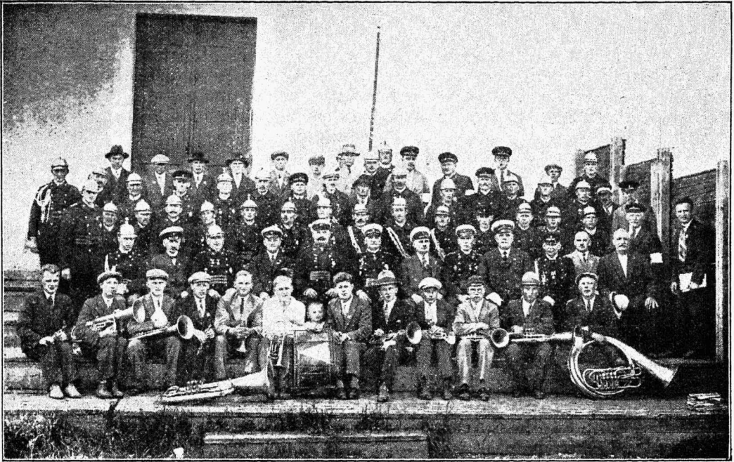
Väike-Maarja tuletõrje 30 a. juubeli pidu.

Päevakord on järgmine: (kirjutatakse protokoll liiikmetele saadetud päevakord; peakoosolekul on õigus päevakorda muuta. Päevakorra muudatus kirjutatakse protokollis).