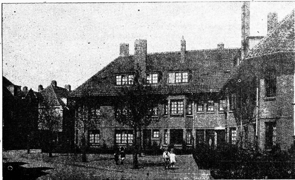
Ühiselumajad aialinnas Oostzaan.

jätnud ning ühenduses sellega olevat tingitud valitsuse tagasikiskumised tööliskorterite küsimuse lahendamiseks. Võrreldes meie oludega, ei ole Holland, kuigi ta kuningriik, kaugeltki veel nii reaktiooni all kannatav, kui Eestis. Eestis on reaktsioon ja tagasikiskumine otse imestustäratavaks saanud. Korterikriisi lahendamise asemel, mille all töölisklass kõige rohkem kannatab, püütakse seda just süvendada sellega, et nüüd üüriseadus ära kaotatakse. Hollandlased loodavad, et sarnane reaktsiooni ajajärk ometigi möödub ja töölisklass