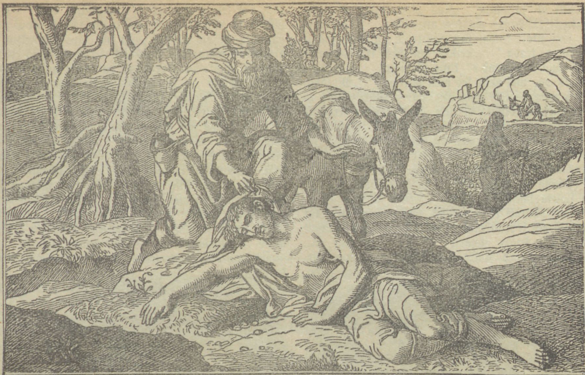
halastaja Saamaria mees.