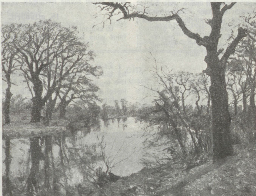
Puud jõe kaldal.

„Kes usub Bojasse, sellel on igawene elu.“ Ma usun teatud mõttes; usun, et Kristus tuli maailma päästma ja usun Temasse nii öelda, et tahab päästa inimesi nii palju, kui wõib; aga mis mul selge ei ole — minu mõõdunud elu küsimus. Kas ma wõin Jumalale öelda, et ma seda tõesti usun, et Kristus on Jumala Poeg ja suri patuste eest, kellest ma kõige esimene olen? Kiri ütleb: „kes usub, sellel on igawene elu.“ Kas ma wõin öelda, et see tõutus minu juures täide on läinud? Selles kõik küsimus seisabki!