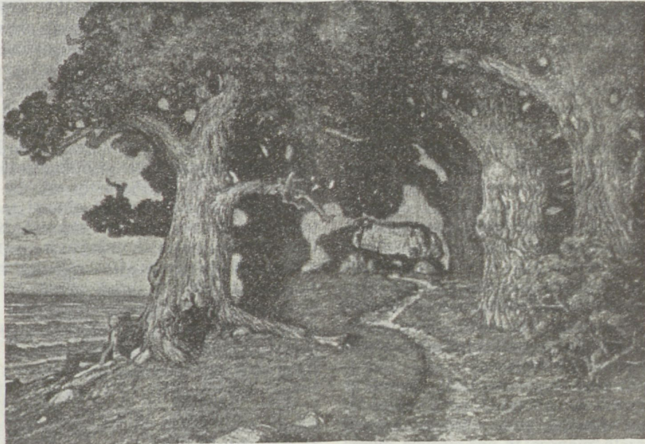
haud puude all.

kui warakewade hommikune udu, kohab lumi-nõretawaid paiku ja wesiloike — kui ojakestes wee woolus, kilisewad jääkillud, jutustawad