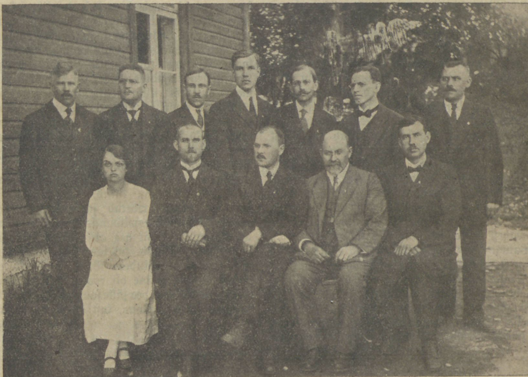
Eesti C. E. liidu uus juhatus.

Ametist äraastatud ajutise juhatusel asemele waliti kolme aasta peale uus kümneliikmeline juhatus. Eraldi waliti juhatusel