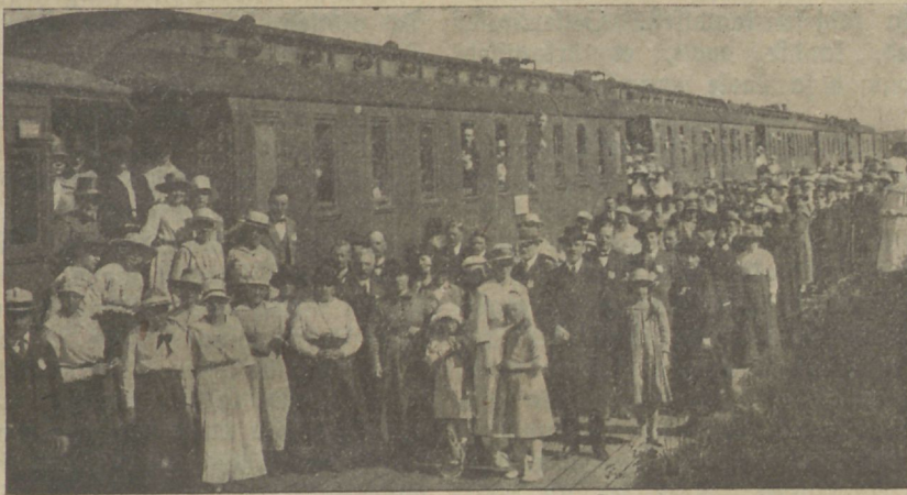
Minewaaastane Soome C. E. Konwerents. Konwerentsile sõitjad.

1. Kor. 15 p. 34 salmi walguses ma ütlen: ärgate dieti üles! Mu efitmene hüüe oleks Teie: sügawamale ärkamistes? Meil on wendi, kes kardawad, et meie ajal ärkamised ei ole mitte enam nii sügawad, kui enne. Sellepärast palun teid, noored, proowige oma Jumala lapsiks saamise filmapiltu. Kas on see ehk olnud üks meeleliigutus. Paljud arwawad, et see on usklikuks saamine, kui nad tundsid oma sees üht liigutust. Paljud arwawad, et kui Püha Waim koputab ukse ees, et sest on küll ja sellepärast tuleb palju poolikuid Jumala lapsi.