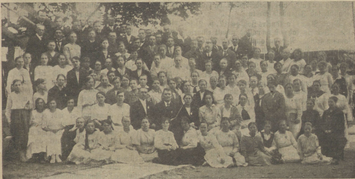
Ühendud usklikude konwerentsi laulukoor.

Israel pidi läbi kõrbe Kanaani maale minema. Tee peal hakkas tõutuse rahwas tõrkudes Jumala