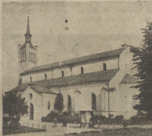
Jaani kirik, kus C. E. koosolek ära peeti.

dikud terwitawad konverentsi oma koguduste ja seltside poolt, lühidalt ka endi tõõst teatades. Uhtekokku 46 terwitust üle Eesti ja ka isegi Siberist, Araalidest, Wladiwostokist, Peterburgist, Ameerikast ja Saksamaalt. Ruilasi tuleb terwitusi äraandma üks noorukewend, kes wast hiljuti ühes teistega Arapeastjat leidnud ja nüüd kõige nende nimel südame palawamaid soowe wälja puistab. Lõpuks saadetakse wastaterwitus kõigiga kaasa ka wäljamaale.