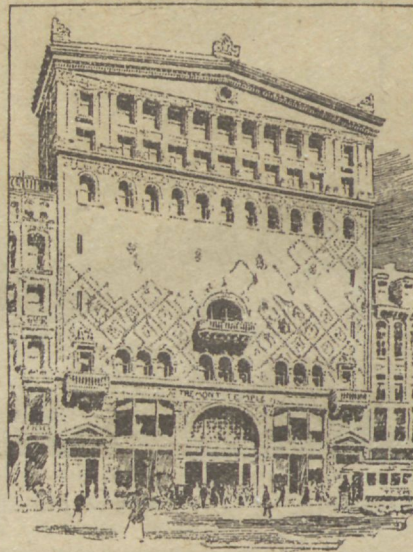
C. E. peakorter New-Yorkis.

Peeti kõige keskel üks suurem koosolek C. E. lastele, kes olid juba nooremad algklassid läbi teinud ja olid liitunud koguduste teenistusse. Neil oli oma pidusõõming Majestic-Hotellis, kuhu müüdi 1100 pääsekaarti, á 2 dollari. Hulgas oli keskealisesi mehi, 35 aastani. Kuumus saalis tõulis ligi 50 gr. Celliuse peal, mehed istusid särgil-la. — Ja siis algas walf