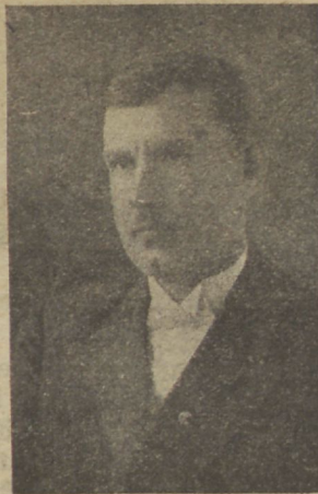
Tombo Happsalu Method. Noorsoo Seltsi juhataja ja C. E. Liidu reisusekretäär.

Ra meid, meie weikesel tööpõllul ja lahinguwäljal on need meie juhataja sõnad finnitanud ja wahwastanud. Üht pilku tagasi lahinguwäljale heites tohime tänuga ütelda: „Isand, Sa oled nii hea olnud! Sa oled wõideldes meie eel käinud ja pimeduse wüürsti kantsid maha lõhkunud. Oma armastusega oled Sa wihawaenu eemale peletanud ja häwitawa jõule tõkkeid teinud. Sina, kes Sa ükspäinist loow jõud oled, — me täname ja kroonime Sind.“