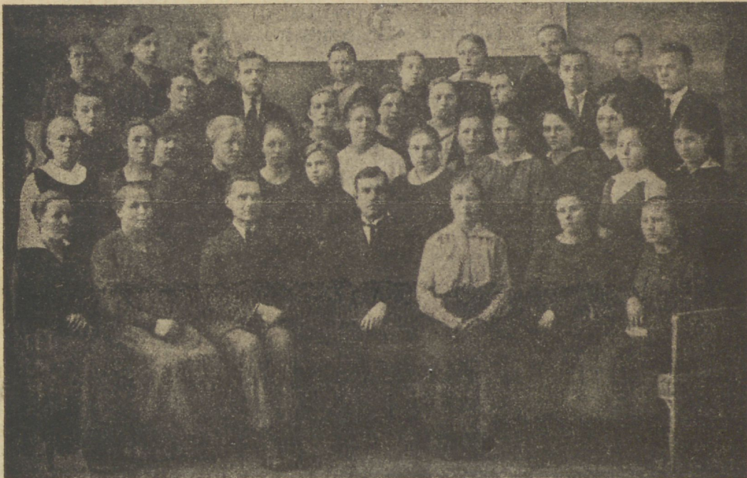
Haapsalu Method. kog. C. E. noored 1921.