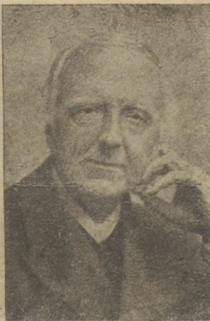
Dr. F. B. Meyer.

Peastearmee töö seisab ses, et waimulikke koosolekuid pidada, mille jaoks harilikult ruumid üüritakse, kui kuski tööd tahetakse alata. — Inimeste juurde minna trahteritesse, wagnimajadesse ja eramajadesse, et seal nendega rääkida ja paluda, kus sellega nõus ollakse; haigete ja waeste juures käia, waimulikku kirjanikest lautada jne. Kus seda lubatakse, peetakse koosolekuid wäljas lageda taewa all ja maršitakse lauldes läbi tänavate. Peale seda peetakse koosolekuid teatrites, tantsusaalides ja teistes niisugustes kohtades, kus need koguvad, kes oma lõbust enam armastawad kui Jumalat. Kus wõimalik, muudetakse wabrikud ja teised hooned koosoleku ruumideks, et neid inimesi pealkuulajateks saada, kes harilikute palvemajadesse ei lähe. Ka püütakse rahwa tähele panu tõmmata mitmesuguste kuulutuste läbi, mis tänavatele wälja pannakse.