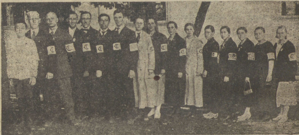
„Tere tulemast“ — C. E. konverentsi toimikond.

Tänuga Jumala poole, wõime mõelda nende kahe noorsoo koosoleku peale kirikutes. Isfand on tõesti rohkem meid õnnistanud, kui me seda mõteldagi oleksime wõind. Loodame ka edaspidistel aegadel sedasama Lemalt, kelle paremas käes palju lõbusaid asju on. O, et wõiksid veel noorsoo kestel eluwee jõed jooksta, sest me oleme ju jõudnud wiimaste aegade siisse.