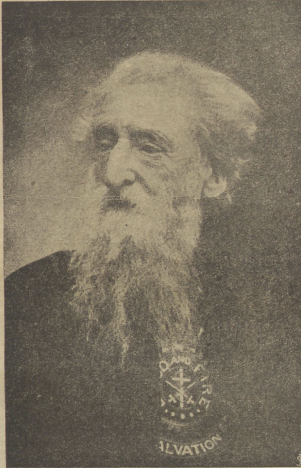
William Booth , †. Peastearmee asutaja ja kindral.

rahwastele, parandusmajad joodikutele, parandusmajad langenud naisterahwaste ja tütarlastele, parandusmajad kurjategijatele, kodud wäljalastud wangide jaoks, ühistodud teenijate, wabriku tööliste, meremeeste ja sõduritele, põllupidamise asundused, jne.