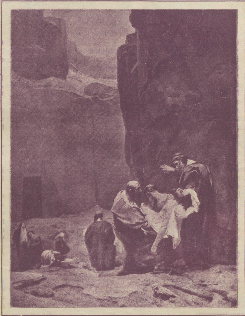
B. Pighlein. — Kristuse haudawiiimine.