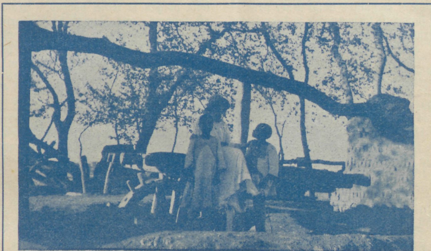
„Külwamine tee ääres.“

pois Taawet, keda wäärtki ei arwatud ette kutsuda, see sai Jumala wali- tuseks, tema rah- wa würstiks (1. Saam. 16: 7—13. (Weel meiegi ustlik- kude tähtja- mail päewil korduwad ikka need wanad nähtused ja Jisai kaldu- wused, ja sellest tulebki, et pä- ris kuningas ja karjane weel paljudel tund- mata on. Eieef. 37: 24.) Kui Jisrael noor ja wäike oli, siis oli ta Ju- malale armas (Hoosea 11: 1), aga kui ta