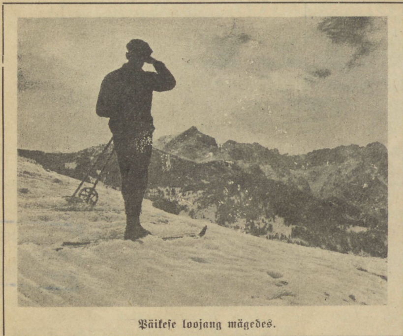
Bäikeje loojang mägedes.

õiget kultuuri, õiget tsivilisatsiooni. Uus inimkond — kõigi aegade unenägu — unistus . . . Kord näeme seda tõesti meel.