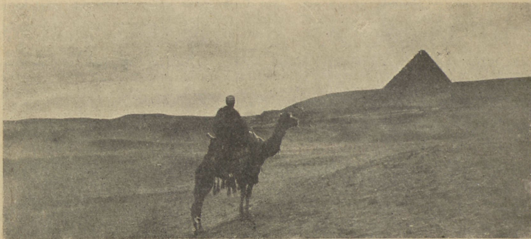
Õrõmelaem püramiidi lähedal.

neid wälja Egiptusest,“ asi, mis on ajalooliselt õige, sest ohwrikombed ehitati neile wast alles Siinail. Selge on samati, et noomitus, mille Isfand oma rahwale andis Jeremia kaudu, ei puutu neid ohwreid, mida nad Isfanda määruse järele olid ohwerdanud, waid ohwriteenistusega ühenduses olewat wälispidisust, wariferlikkust, ja kõige pealt neid koleduisi, mis kuulusid paganlikke kombeisse, „ehk ma küll pole seejuguft käskinud ega mõelnudki,“ ütleb Isfand. Jef. 1 : 11—15 ei Isfand mõista hukka ohwreid, waid patte, ega karista kedagi, kes neid pühi peab, milliseid ta oli seadnud. Prohweti sõnamõök on sihitud jumalakartmatuse wastu ühes pühadega.