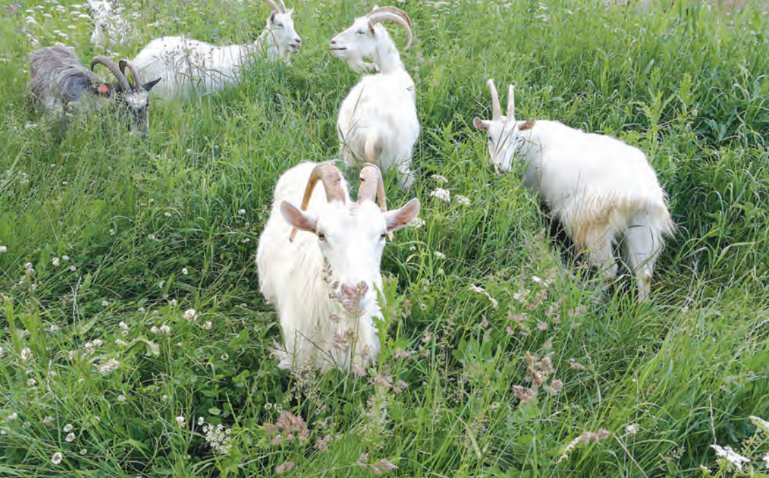
Kitsed Reinu tee ääres.

vallavalitsusega koostöömemorandumi Tuleviku kooli rajamiseks, mis pidi avatama “mõne aasta pärast”. Täna on see lubadus lükkunud määramata tulevikku.