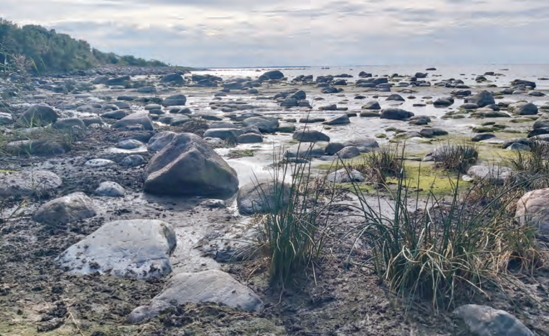
Haabneeme rand killuplatsi juures (foto pole seotud reostusega).

juhtinud sadeveetoru sulgeda on vee-ettevõtte hiljem taganenud.