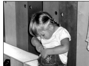
Murumuna lasteaed sai suvel osaliselt remonditud. Lk 4