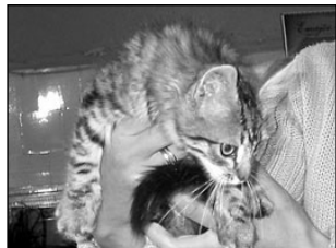
Linnakasside sigimisele aitavad kaasa inimesed ise. Lk 3