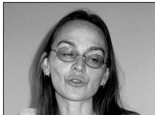
Laupäeval koguneb talvisest tugevam inglite energia Sinilindu. Lk 2