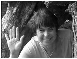
Elva puhkepiirkond kogub kuulsust. Lk 2