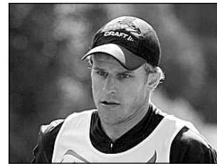
Laskesuusatajad võistlesid Otepääl. Lk 6