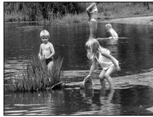
Arbi järve hakatakse puhastama. Lk 3